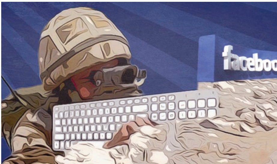
La trinchera del relato.

que no ha dibujado una historia clara y, por lo tanto, ha fallado como construcción de dominio cultural.