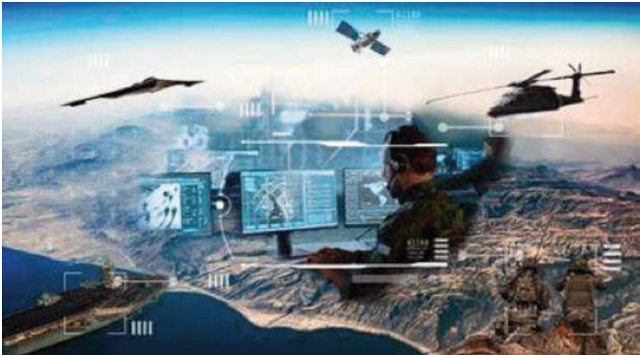
Infografía del entorno multidominio marítimo.

En tercer lugar, aunque el relato con carácter general desborda el espacio clásico del campo de batalla, en la mar éste no es externo únicamente, sino