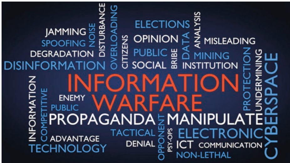
Infografía de la guerra del relato.

Este ámbito socio-cognitivo se extiende más allá de la realidad tangible: el metaverso está transformando todos los aspectos de nuestra sociedad,