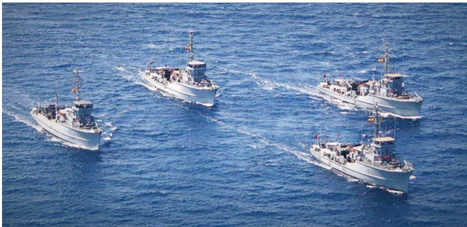
Formación de cuatro dragaminas de la clase Nalón . La Armada recibió 12 unidades en el marco de los acuerdos de defensa con Estados Unidos.

No me quiero ir por las ramas y me centraré en el asunto del epígrafe, el Mando en los primeros empleos de oficial. Creo no equivocarme si digo que la más alta aspiración de cualquier oficial de la Armada es llegar al máximo empleo, pero el mayor privilegio es mandar un buque. Ejercer como Comandante de un buque de guerra es algo que todos los oficiales de Cuerpo General anhelan y ninguno de los que lo han ejercido olvida. Prueba de ello es el cruce