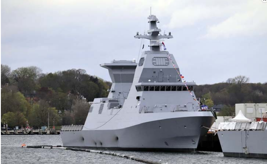
INS Oz, segunda corbeta clase Sa'ar 6 de la Marina israelí.

obligado a Israel a desplegar la versión naval de su escudo protector Cúpula de Hierro ( Iron Dome ), uno de los más avanzados del mundo y que tiene instalado en sus corbetas clase Sa'ar 6, que entraron en servicio en noviembre de 2022, inicialmente previstas para proteger en aguas del Mediterráneo oriental las explotaciones de gas natural del campo de Leviatán y del gasoducto East Mediterranean Gas (EMG), que conecta Ashkelon y El Arish. Hasta ese momento, Israel no se había visto obligado a utilizar dichas capacidades (6).