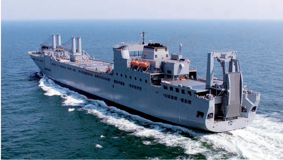
USNS Benavidez .

ingenieros militares estadounidenses, que se inició a finales de abril, participando en la misión el USNS Benavidez , que contó con la protección de las Fuerzas de Defensa de Israel (FDI), según anunció el general Pat Ryder en el Pentágono el 26 del mismo mes. Tal iniciativa deberá permitir que, entrado mayo, el esfuerzo de los militares estadounidenses —que en ningún caso se desplegarán en Gaza— canalice la ayuda a través de una plataforma marina desde la que buques más pequeños la hagan llegar a un muelle artificial, también en construcción (21).