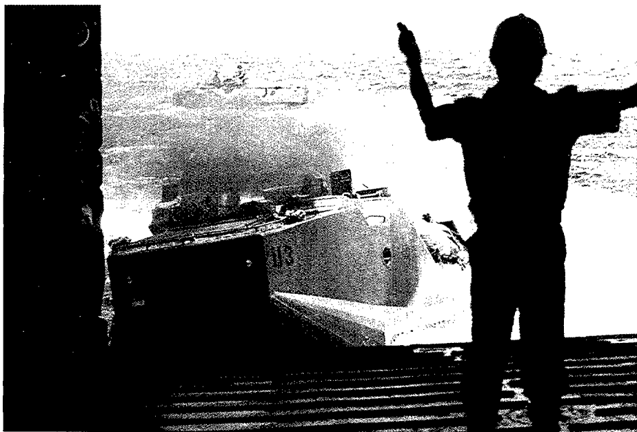
Entrada de una LVT.

Hay dos factores que llevan a que esta situación, complicada pero no altamente peligrosa a nivel general, pueda con más probabilidad derivar en crisis y conflictos regionales. Las dos circunstancias son el integrista exacerbado, que se está extendiendo por la mayoría de los países árabes, y la capacidad armamentística creciente de estos mismos países. No olvidemos los saldos generalizados que, en sistemas de armas, han hecho los miembros de la antigua URSS, empezando por la propia Rusia. Por otro lado, el armamento avanzado y de alta tecnología está proliferando y abaratándose rápidamente.