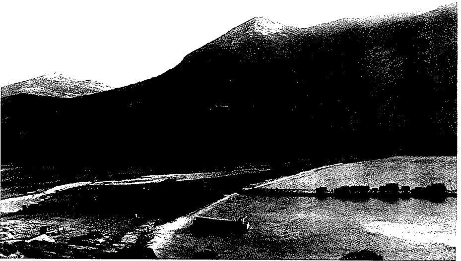
Pontón descargando en cabo Teulada (Italia).

El mando operativo (OPCOM) lo ejerce el SACEUR; es el responsable de todo el planeamiento de la fuerza, aunque como siempre las naciones retienen el mando pleno. El control operativo (OPCON) puede ser delegado, a través de CINCSOUTH, en COMSTRIFORSOUTH, pero no puede ser delegado a niveles inferiores. Dentro de la Célula Anfibia de la División de Operaciones de COMSTRIFORSOUTH, existe un Estado Mayor dedicado permanentemente a analizar los distintos riesgos y posibles crisis en la zona, y planea,