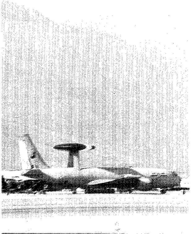
AWACS francés en Aviano.

El concepto «Combinada» —o Combined — equivale a «multinacional», es decir, que se trata de una fuerza en la que están presentes unidades de dos o más naciones. En cuanto al concepto «Conjunta» —o Joint —, corresponde a «multiservicio» o, lo que es lo mismo, es una fuerza en la que están presentes unidades de dos o más servicios (tierra, mar o aire). El concepto de Fuerza