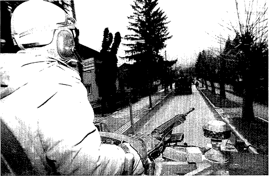
Patrulla en una carretera de Bosnia-Herzegovina.

muchos casos se toman como referencias o puntos de partida para su desarrollo. En los estudios en curso se tienen en cuenta los elementos ya existentes en la Alianza para evitar duplicidades y repeticiones; se intenta mejorar la relación eficacia-coste de los medios y se tiene presente la futura estructura de mandos de la OTAN actualmente en discusión. Asimismo, se tiene en cuenta la entidad de la UEO y el concepto del empleo de fuerzas «separables pero no separadas», que puedan ser utilizadas tanto por la OTAN como por la UEO. Por último, y de acuerdo con las directrices de la cumbre de enero de 1994, también se tiene presente la posible integración dentro de la FOCC de fuerzas de países no OTAN.