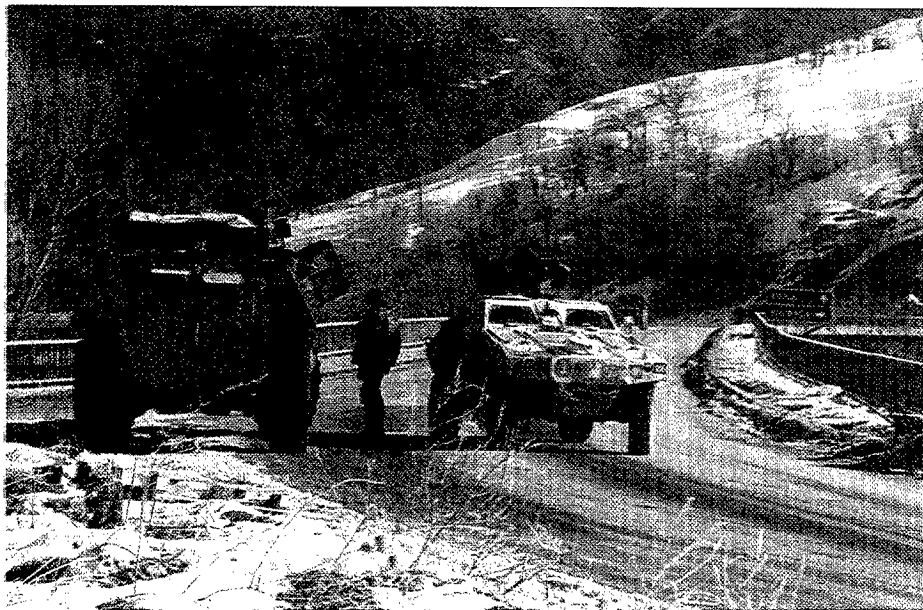
Invierno en Bosnia-Herzegovina.

En este núcleo, en principio se distinguirán dos partes: una de ellas estará formada por una cantidad mínima de personal que, por lo común, estará plenamente dedicado a dicho núcleo —llamado Núcleo Llave ( Key Nucleus )—, encargado de mantener dicho núcleo permanentemente alistado; la otra parte estará formada por personal del cuartel general OTAN en el que se encuentre el núcleo, con «doble gorra», es decir, que se tratará de personal que desarrollará sus cometidos en el citado cuartel general OTAN y a la vez en el núcleo, en donde se integrará para su dedicación plena en el momento en que se active el cuartel general de FOCC.