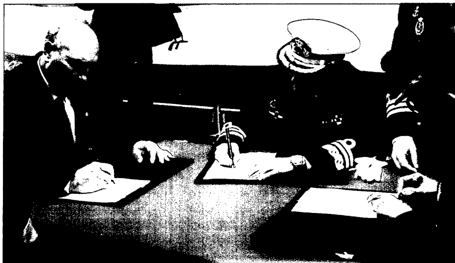
El director de la factoría de la E. N. «Bazán» de Ferrol, el almirante del arsenal y el general interventor de la JAL firmando el acta de recepción del Galicia .