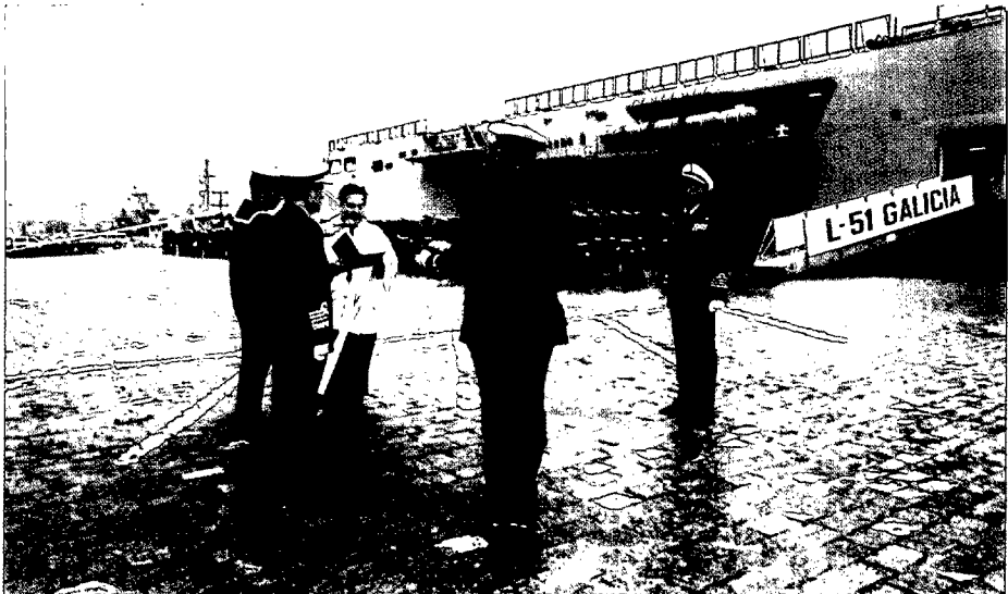
Entrega y bendición del Galicia , presidido por el AJEMA.