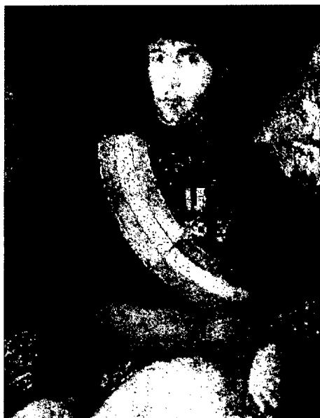
Baltasar Hidalgo de Cisneros Torre, virrey del Río de la Plata.

Liniers, en unión del obispo don Rodrigo Antonio de Orellana; el gobernador, don Juan Gutiérrez de la Concha; su asesor don Victoriano Rodríguez; el coronel de milicias, don Santiago Allende; el oficial real, don Joaquín Moreno, y el sacerdote don Pedro Alcántara Jiménez; digamos como final que, después de sufrir malos tratos y vejaciones, fueron fusilados, excepto el obispo y sacerdote, que fueron expatriados. Triste final el de don Santiago Liniers y Bremond, de «echado de honor, firmeza y probidad».