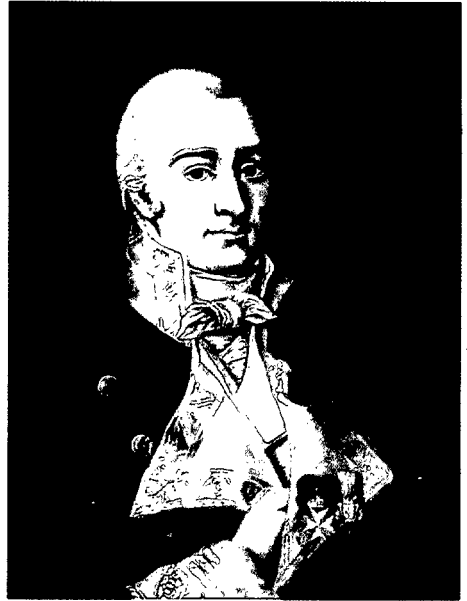
Santiago Liniers y de Bremond (1753-1810), jefe de escuadra de la Real Armada. (Óleo anónimo del siglo XIX, pintado después de muerto Liniers. Museo Naval, Madrid).

El día 20 de julio se presentaba en Buenos Aires el nuevo virrey, don Baltasar Hidalgo de Cisneros, brigadier de la Real Armada, designado para este cargo por la Junta Suprema Central Gubernativa del Reino, refugiada en Cádiz, siendo recibido por Liniers, que para esto se había desplazado de su residencia, proponiéndose regresar a la Península (junio de 1810), cuando ocurrió la sublevación de Buenos Aires (25-5-1820), con la destitución del virrey, quien envió a Liniers un comunicado a fin de que, dado el gran prestigio que éste tenía, influyese en lo que pudiera para sofocar este revolución, fracasó, y después de mil vicisitudes y traiciones, fue hecho prisionero