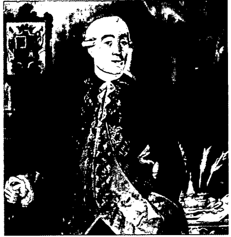
Martín de Mayorga, virrey de Nueva España entre 1779 y 1783.

para que fuera a la conquista y evangelización de las islas Marianas, se preocupó también de la construcción de obras de defensa en las costas de su jurisdicción; enemigo acérrimo de la infame trata de esclavos, puso todo su interés en combatirla; envió una expedición al sur de Chile; en el archipiélago de Chonos hay una isla que bautizó con el nombre de Manceira, el de su título nobiliario. Cesó en el cargo de virrey el 20 de noviembre de 1673.