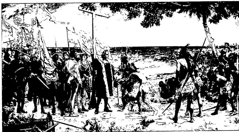
Primer homenaje a Colón (12 de octubre de 1492). (Óleo: José Granelo pintado en 1892 para conmemorar el IV Centenario del Descubrimiento. Museo Naval, Madrid).

descriptiva, dramática y poética del relato, que revelan grandeza de alma, sensibilidad y pleno dominio del idioma, en la antología de las mejores obras poéticas (que no prosaicas) escritas en la maravillosa lengua de Cervantes.