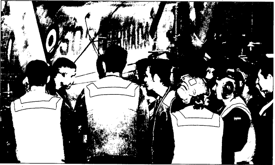
Personal del servicio de vuelo del portaaviones Príncipe de Asturias . (Foto: L. Díaz- Bedia Astor).

formaban parte de nuestra «cultura». Si por volcar todos nuestros esfuerzos en la captación de marinería producimos un efecto de «abandono» en cabos primeros, suboficiales y oficiales, pagaremos las consecuencias muy pronto, cuando sobre los hogares que antes nos entregaban a sus hijos comience a planear la sombra de la insatisfacción laboral del padre (o de la madre).