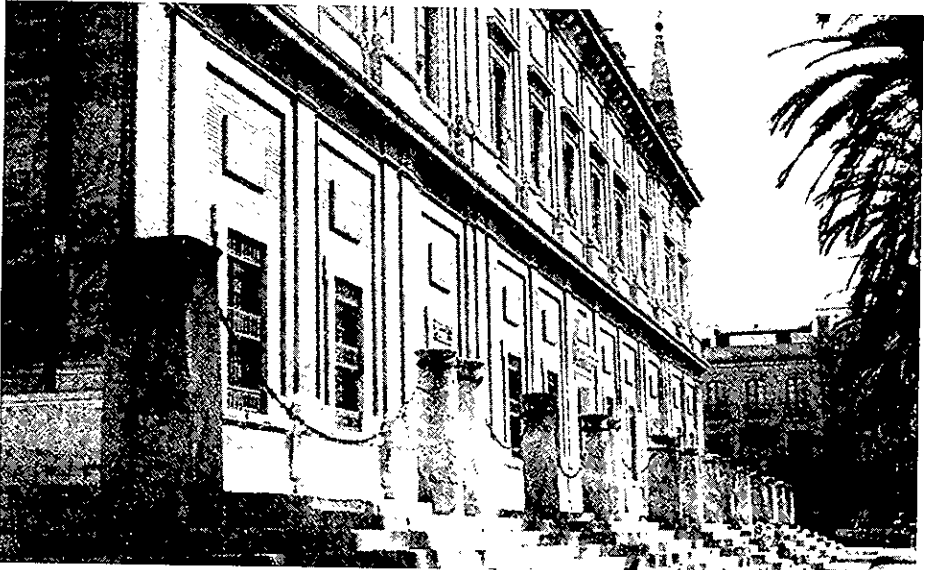
Casa de Contratación, Sevilla.

En cuanto a los consulados, venían a ser como los tribunales comerciales de los códigos francés o español modernos. Eran en España institución añeja y bien probada. Los propios mercaderes eran sus organizadores y creadores natos, así como los electores del prior y demás cónsules que los constituían. Había consulados en Barcelona, Valencia, Zaragoza, Burgos, Bilbao y más tarde en Sevilla. «Y a imitación de este Consulado de Sevilla, por haberse después poblado y ennoblecido tanto las ciudades de México en la Nueva España y de los reyes de Lima, en el Perú...», se fundaron consulados en ellas con análoga organización e idénticos derechos, en 1603 y 1641, respectivamente.