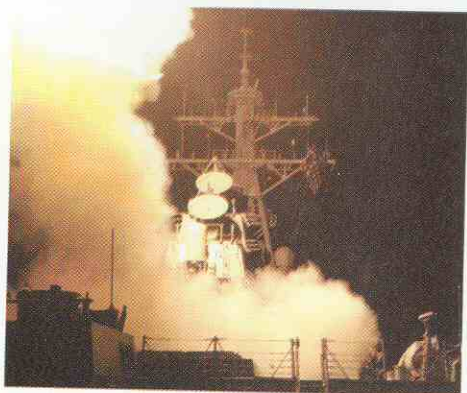
Lanzamiento de misil Tomahawk por el USS Donald Cook .

El asalto comenzó con desembarcos helitransportados mediante CH-47 Chinook y Sea King de las marinas británica y norteamericana, que desembarcaron royal marines en varios puntos de la península de Al Faw, y posteriormente, varias oleadas de lanchas rápidas, que partieron tanto de los buques como de la cercana isla kuwaití de Bubiyan, así como LCU que transportaron el material más pesado. Las operaciones fueron llevadas a cabo de manera rápida, sin bajas entre las tropas asaltantes, a pesar de que hubo varios cruces de fuego con las tropas que defendían las instalaciones.