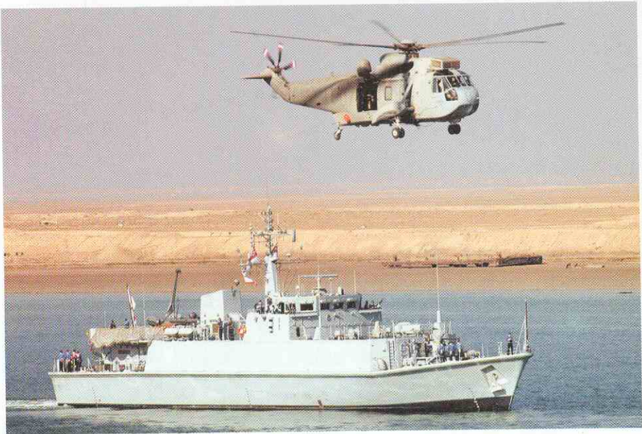
El cazaminas británico Sandow y un helicóptero Sea King .