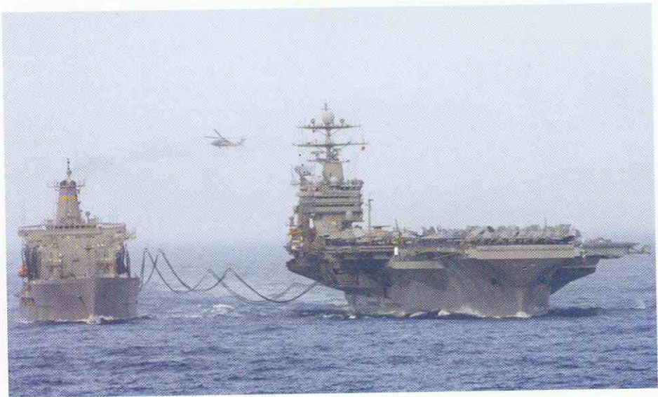
El USS Harry S. Truman aprovisionándose en la mar.

La Marina australiana tenía en la zona la fragata HMAS Anzac y el buque de apoyo HMAS Kanimbla .