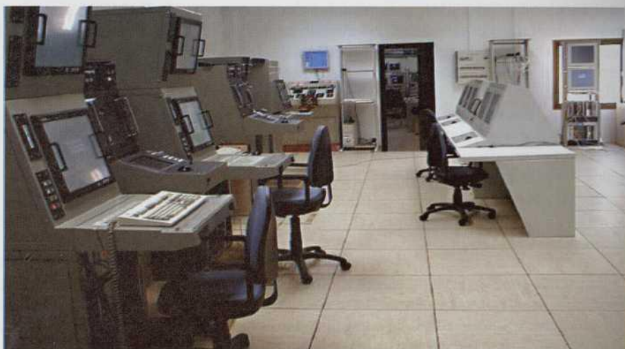
Simulador de caza de minas (SACAZ).

to. Básicamente se trata de dos drones construidos en GRP, dirigidos a distancia (normalmente desde un cazaminas) y capaces de remolcar una rastra combinada magnética, acústica y eléctrica. La longitud de la rastra es regulable en función de la firma que se quiera simular o del espacio disponible en aguas restringidas. Las rastros son muy sencillas y autónomas, es decir, capaces de generar con el movimiento la energía que precisan para su funcionamiento. En particular, la rastra magnética estará formada por imanes permanentes con flotabilidad positiva y de diferentes tamaños. Este tipo de sistemas ha sido utilizado recientemente en la limpieza de los accesos al puerto iraquí de Um Qasar, y su necesidad se deriva de la existencia de fondos en los que la caza de minas es poco efectiva, así como de minas que generan muy poco eco sonar, haciéndose así presente la necesidad del rastreo como complemento de la caza, reflejada en el conocido aserto «caza donde puedas y rastrea donde debas».