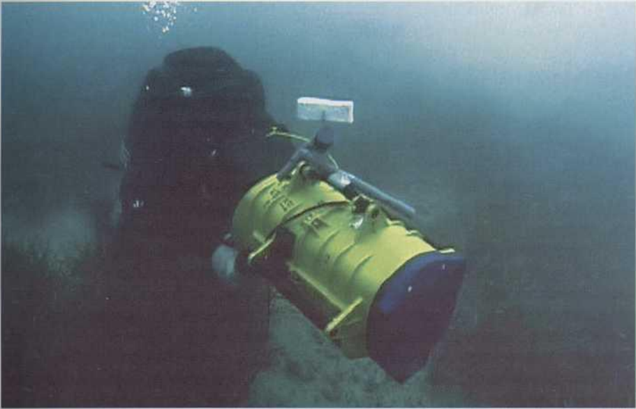
Buceador de MCM con sonar de mano.

CIS y en el suministro de víveres, sanidad, combustibles, lubricantes, sostenimiento de equipos, etc. Todo ello sin olvidar su capacidad de apoyo a buceadores.