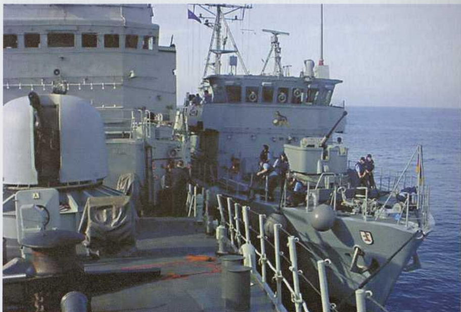
BMA Diana apoyando al cazaminas alemán Frankenthal .

El BMA Diana , además de permitir ejercer el mando de la MCMFOR-SOUTH, ha apoyado de forma notable a los buques que la componían durante un año, habiendo efectuado, en particular, en torno a 40 petroleos en la mar, actuando así como multiplicador de la capacidad de esta importante Fuerza de la OTAN. Además, sus posibilidades de apoyo son notables en el campo