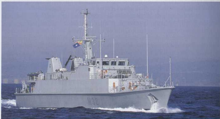
Cazaminas Sella .

Ante todo, los nuevos buques aportan un sistema de mando y control (SMYC) basado en un soporte informático más moderno y potente, capaz de utilizar cartografía digital comercial y capas adicionales de información militar (AML). Asimismo, la Armada decidió en su momento dotar a estos buques de un nuevo vehículo de identificación/neutralización de minas —Minesniper— mucho más económico y ligero, del tipo conocido como single shot . Esta clase de vehículo, el cual se pierde tras su empleo, se está imponiendo en muchas marinas y ha sido ampliamente utilizado durante las operaciones de limpieza del puerto iraquí de Um Qasar, ante los problemas que planteaban