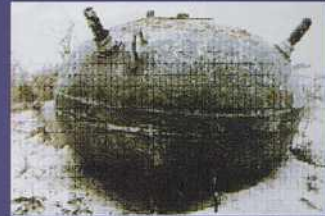
MINA IRAQUI LUGM-145 DE TRES CUERNOS QUÍMICOS DIÁMETRO 1 MT 160 KGS TNT

Daños provocados por una mina de orinque en el casco del buque USS Trípoli , en la Primera Guerra del Golfo.