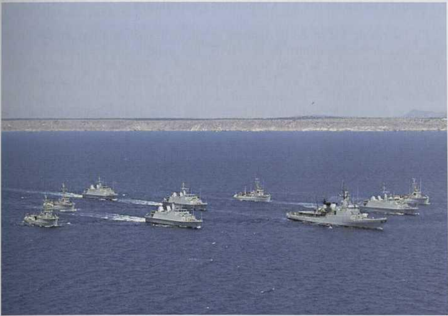
Fuerza de MCM navegando en formación.

Pues bien, hoy en día en el mundo existe un stock de minas muy elevado (solamente la extinta URSS contaba con un arsenal en torno a las 250.000), unos 34 países las fabrican y otros muchos las han adquirido en el mercado, incluidas algunas minas de influencia magnético-acústica de nueva generación fabricadas por países más desarrollados. Todas ellas, pero en particular las de tecnología más reciente, presentan desafíos importantes para las marinas modernas, como la nuestra, a pesar de su alta capacitación en este importante campo de la guerra naval.