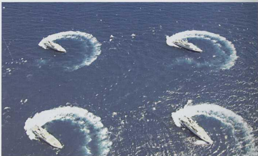
Segura, Sella, Tambre y Turia evolucionando.