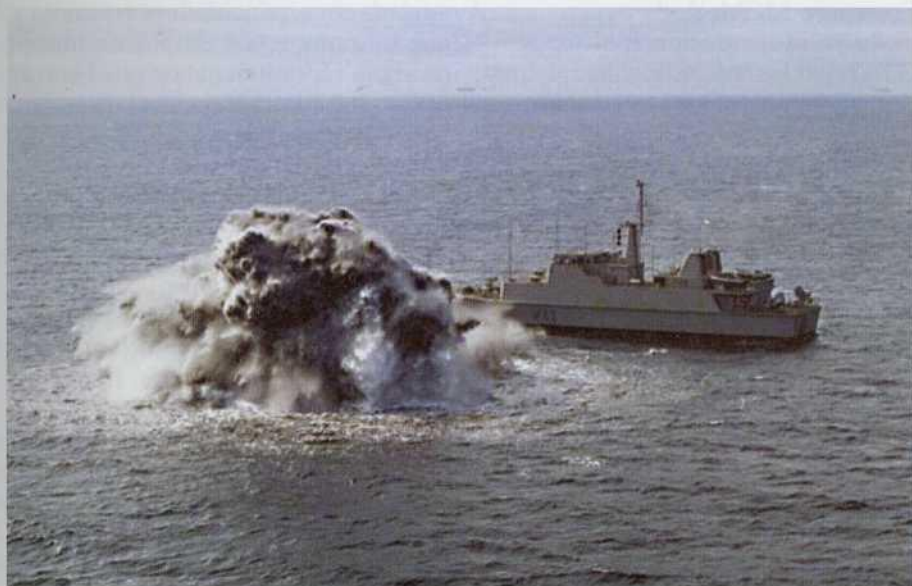
Cazaminas Sella efectuando pruebas de resistencia.

siete cursos monográficos, con un excelente resultado y sin apenas coste para la Armada.