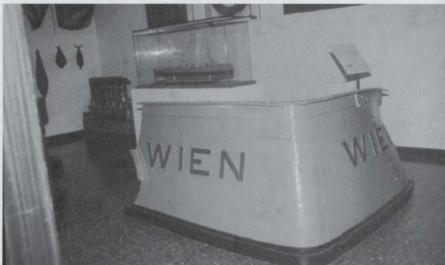
Trozo de la popa del acorazado austriaco Wien , hundido por la acción de una lancha torpedera italiana el 9 de octubre de 1917 en su base de Trieste, rescatado como trofeo en 1920.

El transporte fluvial está igualmente representado por una Burchio , muy parecida a la anterior pero de fondo plano y manga generosa, impulsada a base de vela, caballerías o pértiga, careciendo de cualquier tipo de decoración, con la particularidad de estar dotada de doble timón, maniobrado según una técnica muy antigua. Este tipo de embarcación se mantuvo en servicio hasta bien avanzado el siglo XX.