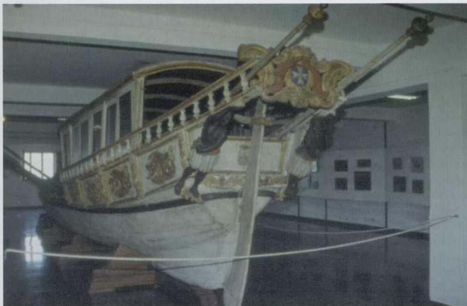
Detalle de la popa de la falúa de ceremonia que en 1866 paseó en triunfo al rey de Italia Vittorio Emanuele II en su visita a Venezia. (Foto: A. Campanera).

Las salas contiguas están dedicadas por completo a las artes de la pesca, reflejando la gran variedad existente, pero haciendo especial hincapié en las genuinamente venecianas. Entre todas éstas destaca una en donde se custodia una extraordinaria colección de embarcaciones chinas de pesca y transporte, realizadas por encargo del prestigioso coleccionista francés Etienne Sigaut, que supervisó personalmente todas las fases de su delicada construcción.