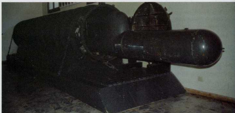
Uno de los contenedores-estanco diseñados para transportar a bordo de submarinos, los famosos Maiale de la X Flotilla MAS.

en la ceremonia de los esponsales de la República con la Mar, en el curso de la festividad del día de la Ascensión, momento en que el dux lanzaba a las aguas un anillo de oro, simbolizando el desposorio. El último fue botado en 1728, estando impelido por 168 marineros que maniobran 42 remos.