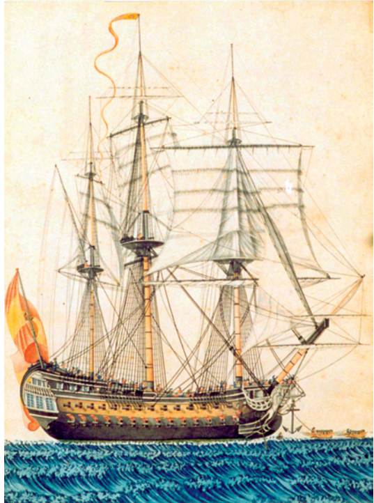
Navío San Telmo . (Museo Naval. Madrid).

1824.—El 26 de mayo, el bergantín-goleta Mágica naufragó en cayo Confites (canal viejo de Bahamas).