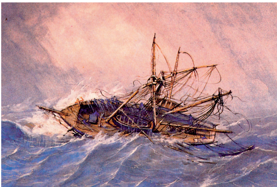
Naufragio de una goleta. (Museo Naval. Madrid).

1813.—Exclusión en La Habana del bergantín Regencia y la fragata Cornelia .