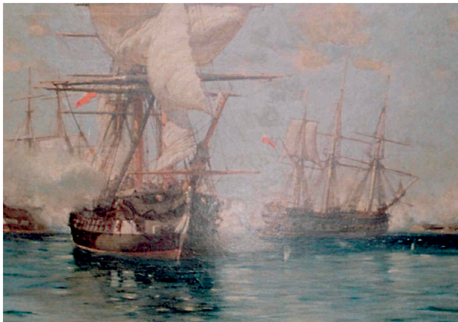
Captura de la fragata Reina María Isabel . (Óleo de Somersal).

1818.—El 17 de mayo es apresada la goleta-correo Ramona en el tránsito de Puerto Rico a Costa Firme.