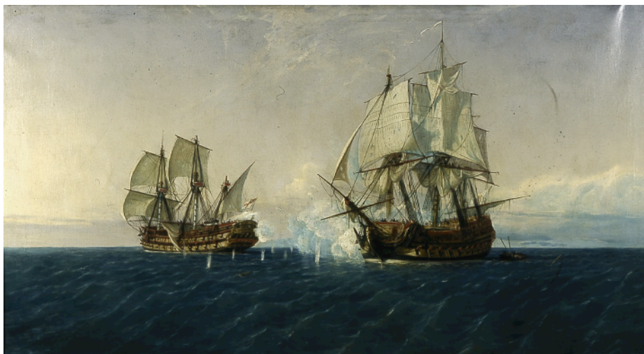
El combate del navío español Catalán con el británico Mary, 1719. Lienzo de Rafael Monleón. (Museo Naval, Madrid).

se me hizo la luz al echar una ojeada en el tomo segundo del citado Catálogo de Pinturas del Museo Naval ; en él aparece un retrato de don Antonio Serrano con una cartela en la esquina superior derecha, en la que puede leerse, con dificultad —lo conseguí por medio de una lupa—, que la posición del combate fue en la latitud 23^{\circ} 30' norte y longitud 294^{\circ} 10' , información fundamental y que difiere de la contenida en la reseña del cuadro de Monleón mencionada al principio.