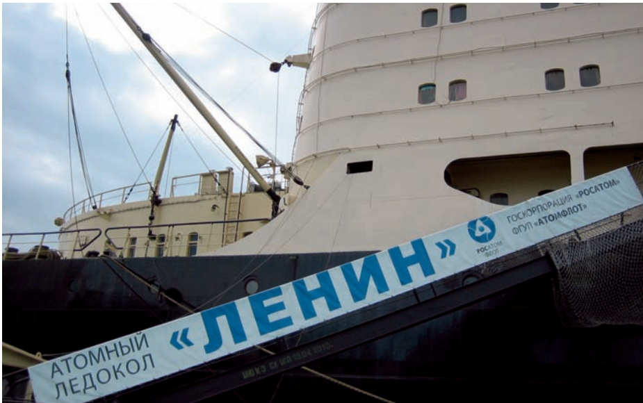
Rompehielos nuclear Lenin .

Por otro lado, la apertura de las aguas costeras del norte de Canadá, Alaska y Rusia implica sobre todo un aumento significativo de responsabilidades de gestión y de protección para dichos países. Los 23.000 kilómetros de costa que debería defender la Federación Rusa supondrían la necesidad de un notable refuerzo, que ya está empezando a producirse en forma de rompehielos y buques adaptados al hostil clima del norte.