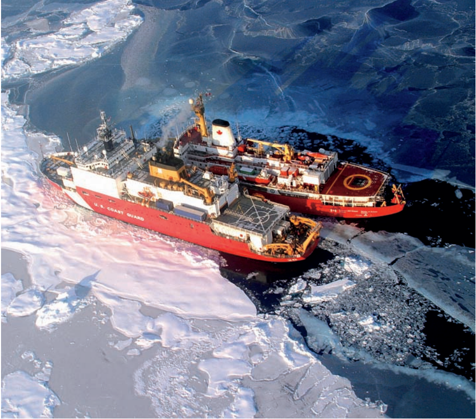
Rompehielos guardacostas canadiense y estadounidense en el mar de Beaufort.

o, simplemente, de «mostrar la bandera» como parte de la Unión Europea o de forma autónoma, puede reportar importantes beneficios a medio plazo.