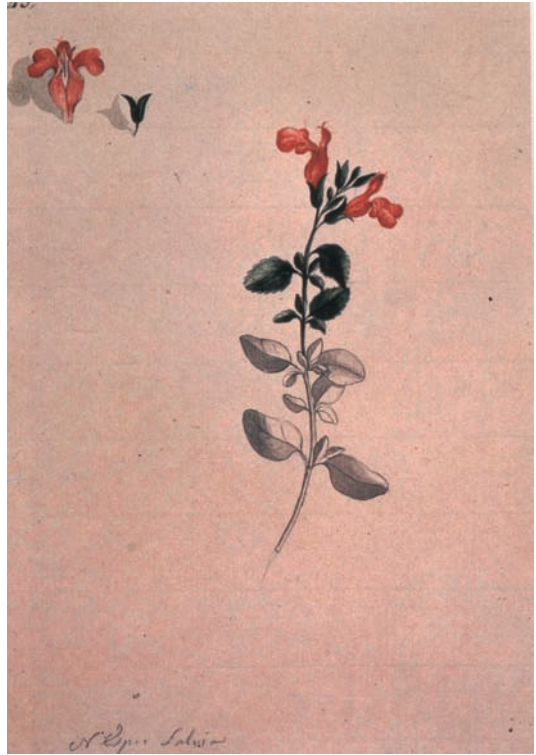
Salvia de México. (F. Lindo. Real Jardín Botánico).

Nuevas y meritorias singladuras esperan a Malaspina en su nuevo empleo. Al mando de la fragata Asunción realizó un viaje a Manila y a otros puntos de aquellos lejanos mares, regresando a España en 1784. Permaneció poco tiempo de teniente de la Compañía de Guardias Marinas de Cádiz. En 1786 realizó un nuevo viaje a Manila con la fragata Astrea a través del cabo de Hornos, dando la vuelta al mundo al regresar por el cabo de Buena Esperanza. Y de nuevo en Cádiz en 1788, salió de este puerto a finales de julio de 1789 con las corbetas Descubierta y Atrevida . Son los prolegómenos de la famosa expedición científica; de un increíble viaje de sesenta y dos meses, donde se mezclaron las exploraciones científicas, marítimas e incluso políticas por las Américas y el Pacífico.