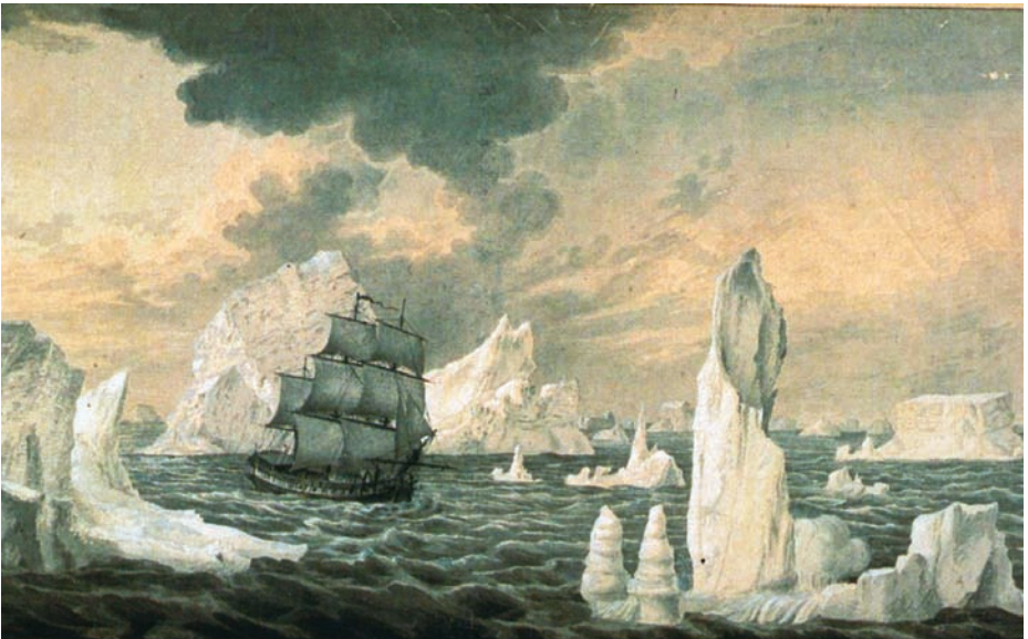
La corbeta Atrevida entre bancas de nieve el día 28 de enero de 1794. (Fernando Brambila. Museo Naval).

Liquidado el conflicto con Marruecos, y tras la marcha del ministro Esquilache, se entendió como momento adecuado para infligir una dura lección a la eminencia gris de aquella guerra, el bey de Argel. España preparó una expedición con casi cuatrocientos buques y atacó la rada argelina, pero la operación resultó un completo fracaso y, al decidirse el reembarco, Malaspina participa activamente en la penosa empresa de evacuación de los heridos, reintegrándose a su navío más tarde.