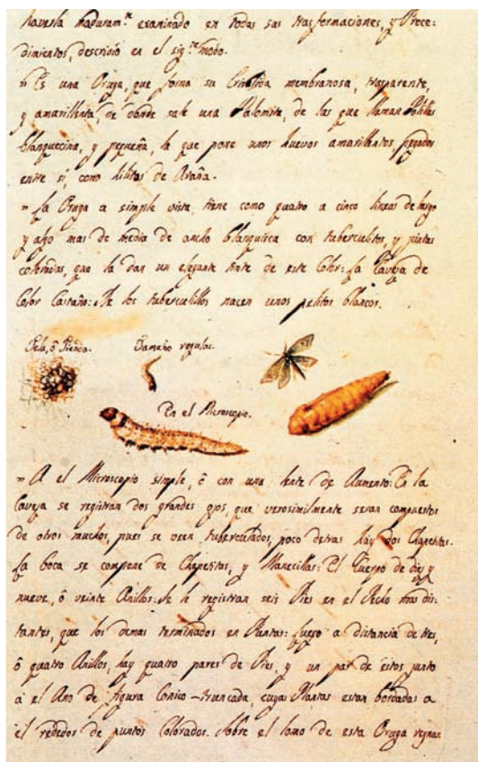
Página de un diario autógráfico de Malaspina.

retoños alcanza la mayor fama». No fue aventurado su juicio. Como hombre de vasta cultura, abierto a los problemas socioeconómicos de su tiempo, se hizo intérprete de la inminente transformación de la sociedad.