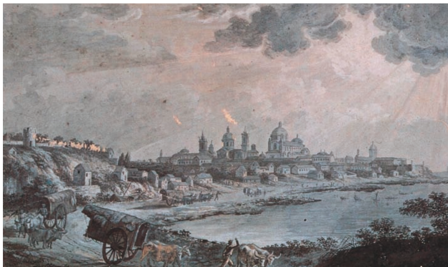
Buenos Aires desde el camino de las Carretas. (Fernando Brambila. Museo Naval)..

Promovido a alférez de navío, de diciembre de 1777 a septiembre de 1797 realiza su primer viaje oceánico a bordo de la fragata Astrea , que manda el capitán de navío Antonio Mesía. El puerto de destino era Manila, capital del más lejano territorio hispano, y su retorno se hizo por la ruta del cabo de Buena Esperanza. Más de siete meses se emplearon en el viaje de ida y casi ocho en el de vuelta. Cinco y medio fueron también los meses que duró la estancia en Manila en espera de la estación de vientos favorables.