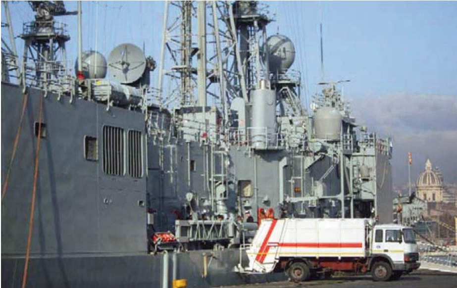
NAMSA apoya en puerto a las unidades navales a través de su Programa de Servicios Portuarios.