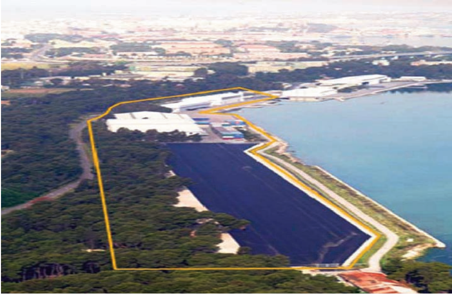
Instalaciones de almacenamiento de NAMSA en Tarento (Italia).

Servicios Logísticos, Servicios Portuarios, Transporte y Almacenamiento, e-Logística, por citar sólo algunos. Así, la mayor parte de los costes operativos comunes con cargo a ATHENA que pueda solicitar el comandante de la operación y sean aprobados por el Comité Especial cabría obtenerlos a través de la NAMSA.