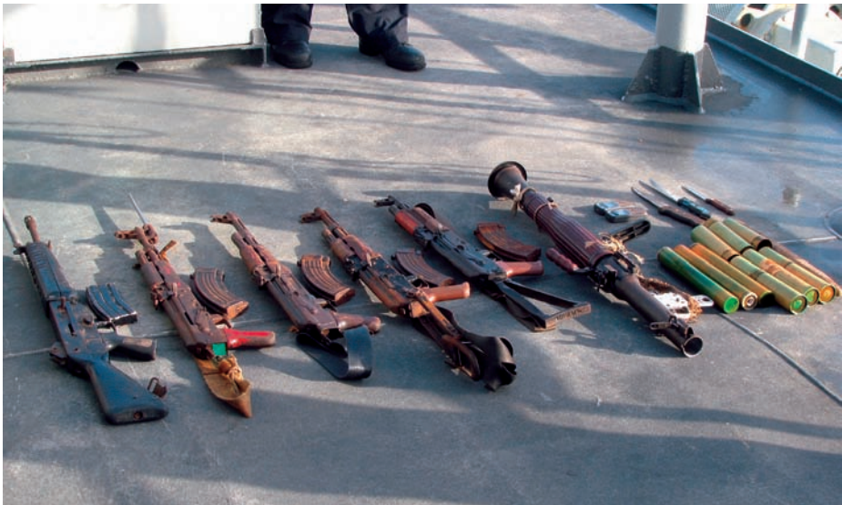
Armamento y munición de distinto calibre incautados a piratas somalíes.

Amparados en lo fácil que resultaban estas capturas y los cobros de ciertos rescates iniciales que comenzaron a pedir para liberar a aquellos primeros barcos secuestrados, esta actividad comenzó a crecer de forma desproporcionada hasta llegar a lo que es hoy en día, con grupos de piratas perfectamente