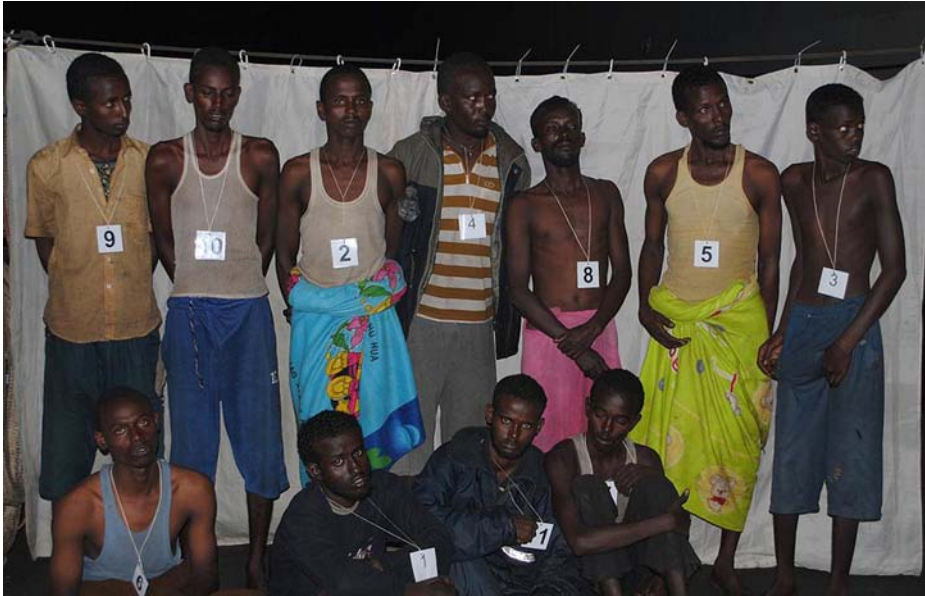
Presuntos piratas detenidos.

do lazos con Al Qaeda y están acusados de participar en atentados terroristas en Nairobi y Dar es Salam en 1998 y 2002. El último ataque suicida de Al-Shabab fue el 9 de septiembre de este año, cuando dos vehículos atacaron el aeropuerto de Mogadiscio, ocupado por tropas de AMISOM, matando a dos soldados y varios civiles. En marzo de 2009, en una cinta grabada, Osama Bin Laden pedía a los somalíes apoyo para Al-Shabab. Sin embargo, aparte de cierto apoyo logístico o de adiestramiento de las bases de Al-Shabab, se desconoce claramente si Al Qaeda ejerce hoy algún tipo de control operativo o de otro tipo sobre Al-Shabab. Tampoco parece que tengan capacidad de operar abiertamente en el extranjero, a pesar de que reclamaron ser los autores del doble atentado en Kampala (Uganda) que provocó 74 muertos y 71 heridos. No debemos olvidar que Uganda y Burundi son los únicos países que, de momento, aportan tropas a AMISOM, la misión de la UA en Somalia. Pero de eso a una completa transnacionalización del conflicto somalí hay todavía un trecho, y de momento los servicios de inteligencia occidentales descartan que ese hecho sea inminente. Aunque más tarde o más temprano... todo puede ocurrir. ¿Quién se iba a imaginar un atentado como el del 11 S en pleno territorio de los Estados Unidos?