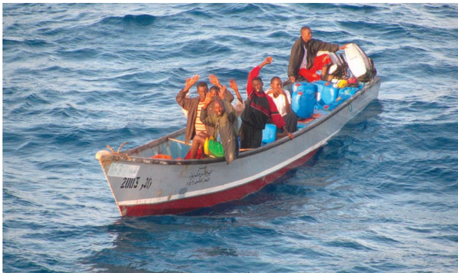
Localización de embarcaciones en la costa somalí.

«no». Se sospecha que podría haber ciertas conexiones entre los grupos insurgentes y los piratas, fundamentalmente de tipo económico, pero, aun en el posible caso de que en ciertas ocasiones parte del dinero recaudado por los piratas en algún secuestro haya ido a las manos de algún grupo radical, eso no significaría que los grupos radicales estén financiados por los piratas ni que los piratas defiendan la causa islamista radical; ni siquiera que los unos se sustenten o estén subordinados a los otros.