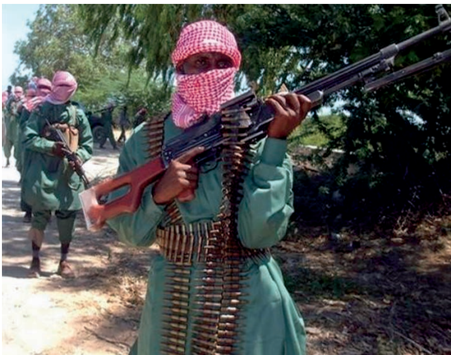
Milicianos de Al-Shabab.

Sus lazos ideológicos con Al Qaeda son indudables. En un vídeo que se hizo público en 2008, su líder Ahmed Abdi Godane habló de Osama Bin Laden como su emir y jefe y afirmó que «sus yihadistas ganarán la batalla contra los cruzados occidentales». Algunos de sus dirigentes tienen o han teni-