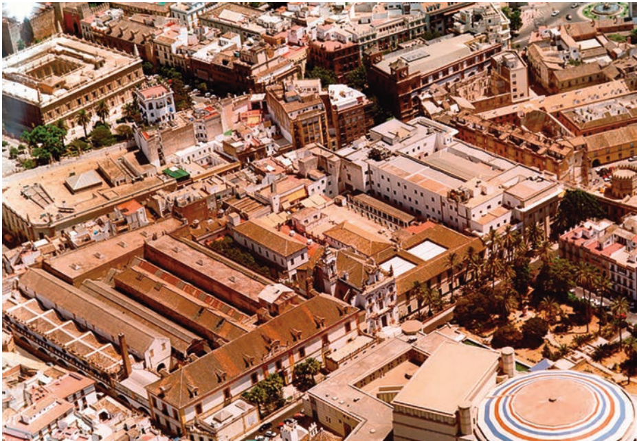
Vista aérea actual del conjunto.

El emplazamiento elegido tenía unas condiciones muy concretas, ya que se trataba de una zona extramuros (aunque adosada a la muralla) y, como se ha