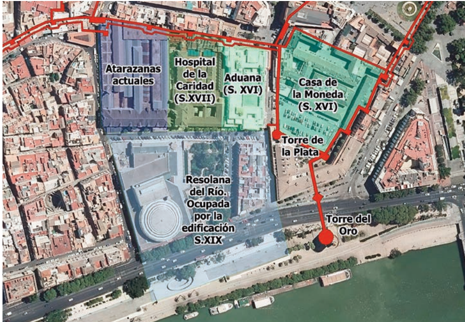
Ortofoto actual. (Elaboración propia)

Las imágenes adjuntas muestran la evolución expuesta sobre el famoso Plano de Olavide (1771) y sobre una ortofoto actual. En rojo figura el sistema defensivo de Sevilla en la Baja Edad Media.