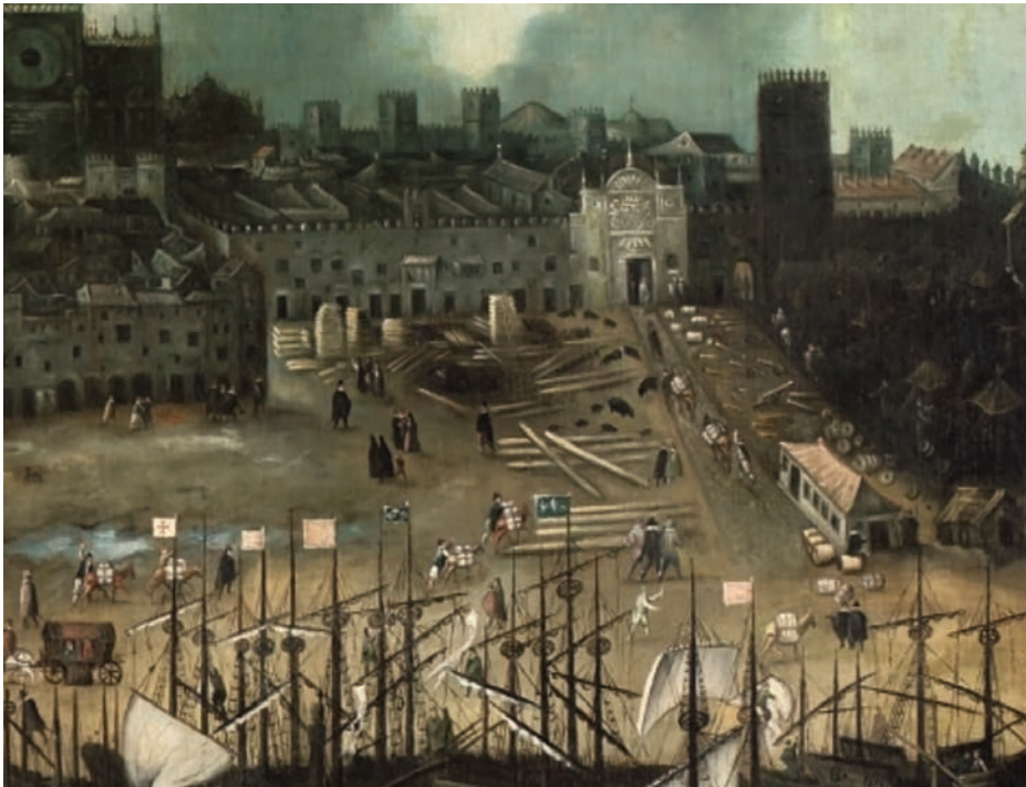
Detalle de las Atarazanas en Vista de la ciudad de Sevilla , de Alonso Sánchez Coello. (Museo del Prado)

En tiempos de Fernando III y Alfonso X, se suceden las conquistas en el litoral meridional de la península ibérica (Cartagena, 1245; Sevilla, 1248; Cádiz, 1262), que dan paso a la lucha por el control del estrecho de Gibraltar. Comenzará así la conocida batalla del Estrecho, que se desarrolló desde 1274 hasta mediados del siglo XIV, en la que se luchó por el control de los puertos del sur peninsular (Tarifa, Algeciras y Gibraltar) contra el Reino nazarí y los benimerines norteafricanos. Esta contienda hizo patente la necesidad de contar con una flota en constante mantenimiento y renovación, siendo el arsenal sevillano el que se empeñó en ello. El dominio castellano del estrecho quedó patente, lo cual tuvo una importancia de alcance europeo que pocas veces se señala: la apertura de un paso marítimo seguro entre el norte de Italia y los