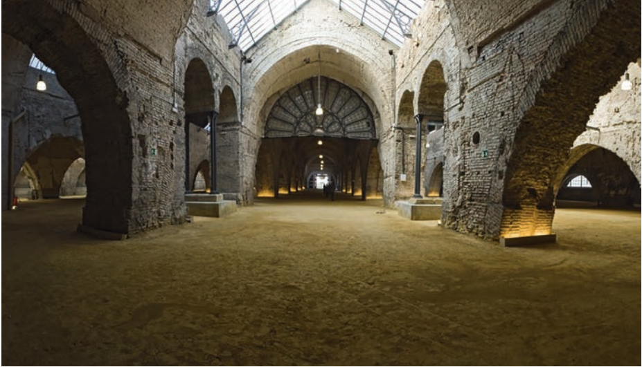
Interior de las Atarazanas en su estado previo a la rehabilitación (imágenes superior e inferior).