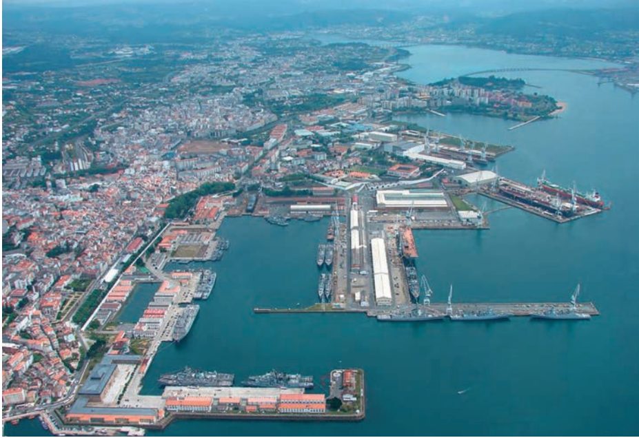
Vista aérea de Ferrol.

disfrutaban los militares en Estados Unidos a la hora de visitar edificios o participar en diferentes actividades, lo cual demostraba el cariño y respeto que los estadounidenses sienten por ellos. Nosotros también nos sentíamos reconocidos, como españoles y como militares.