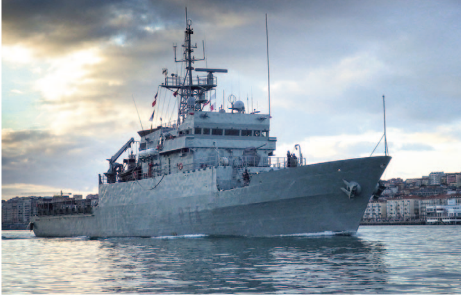
Patrullero Atalaya durante una patrulla de vigilancia marítima.

Además, sería necesario prevenir aquellas prácticas que facilitan la explotación pesquera irregular, mejorando su control e impidiendo prácticas irregulares tales como la artimaña de cambiar el pabellón por conveniencia, los subsidios y apoyos estatales, y los transbordos incontrolados de capturas en alta mar. Asimismo, sería preciso mejorar la trazabilidad de los productos pesqueros, dificultando el comercio de capturas de procedencia ilegítima. Para todo ello se precisa de un poder coactivo coordinado internacionalmente, capaz de ejecutar las normas y de perseguir las infracciones con una vigilancia e inspección adecuadas, así como mediante la creación de iniciativas de cooperación en apoyo de los Estados ribereños con menos capacidades.