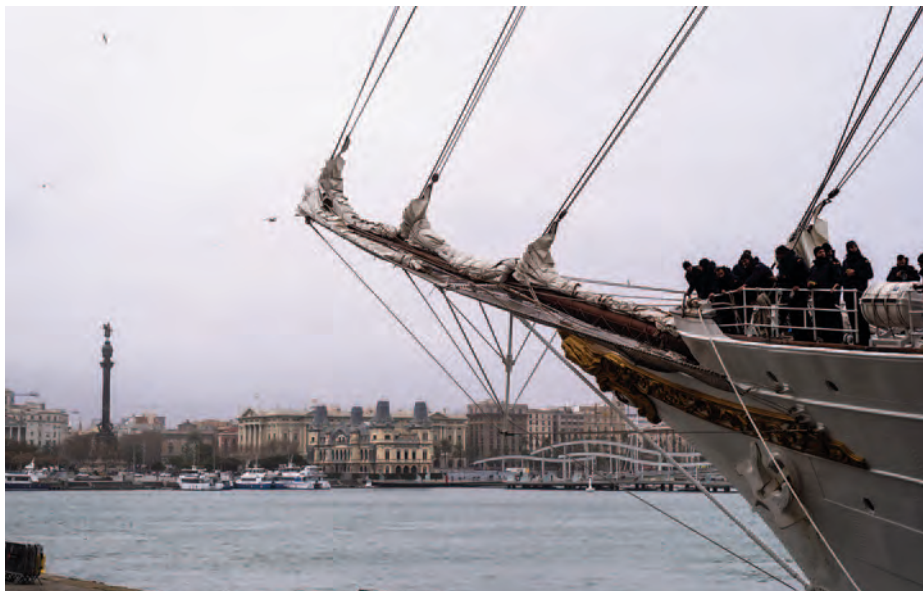
Escala en Barcelona del Juan Sebastián de Elcano, marzo de 2022.

Asimismo, y para que los jóvenes también hayan podido adquirir y apreciar un conocimiento básico de la gesta, se ha elaborado una publicación en formato cómic sobre la expedición y la vida de Elcano. Con un guion riguroso en lo histórico pero desenfadado en el lenguaje para hacerlo ameno y atractivo, la obra muestra los antecedentes del insigne marino de Guetaria antes de enrolarse en la expedición que preparaba Magallanes, las incidencias de la ruta que le llevaron a asumir el mando, la decisión de retornar a España continuando la navegación hacia el oeste y su muerte en el Pacífico a la cabeza de la segunda expedición que la Corona envió a las Molucas.