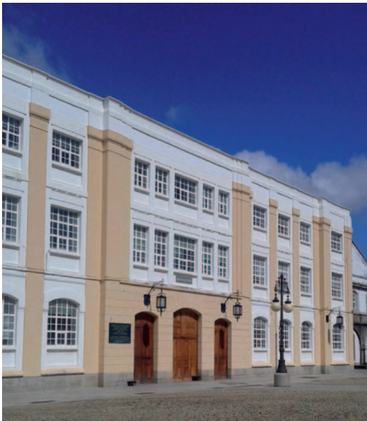
Edificio principal de la Escuela de Máquinas.

Las primeras promociones de tenientes de Máquinas salidas de la Escuela Naval (la 1. a en diciembre de 1951) debieron de sufrir un verdadero calvario para poder adaptarse a las circunstancias propias y ajenas, aparte el panorama socio-profesional que les tocó vivir... Buena muestra de ello figura en los informes que los directores elevaban al capitán general de turno al acabar las oposiciones, haciendo notar «una preparación precipitada y una base poco sólida» de los componentes de la primera convocatoria (1944) y resaltando «el bajísimo nivel social de muchos», junto a las «diferencias tan notables de clase, costumbres y modos» (1948) o la conveniencia de «elear-