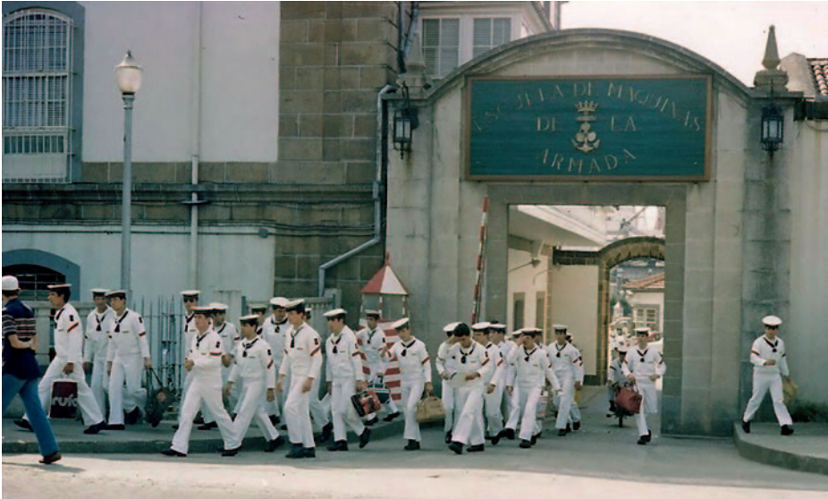
Escuela de Máquinas de la Armada en el Cantón de Molins, Ferrol.

su función a bordo, así como el trato social recibido, teniendo en cuenta la preparación y responsabilidades exigidas.