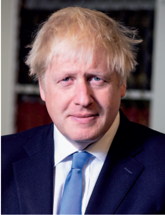
Boris Johnson.

acción exterior para la era post-Brexit. Para Whitehall, este divorcio ha liberado al país de ataduras y le permite asumir mayores responsabilidades. Así, «... nuestra política exterior tras la salida de la UE nos permitirá actuar con mayor rapidez y agilidad, amplificando nuestra voz fuerte e independiente» (3). De hecho, adaptabilidad, agilidad o flexibilidad y la determinación por consolidarse como una potencia global capaz que influya en el desarrollo de los acontecimientos futuros estarán presentes en todo el documento.