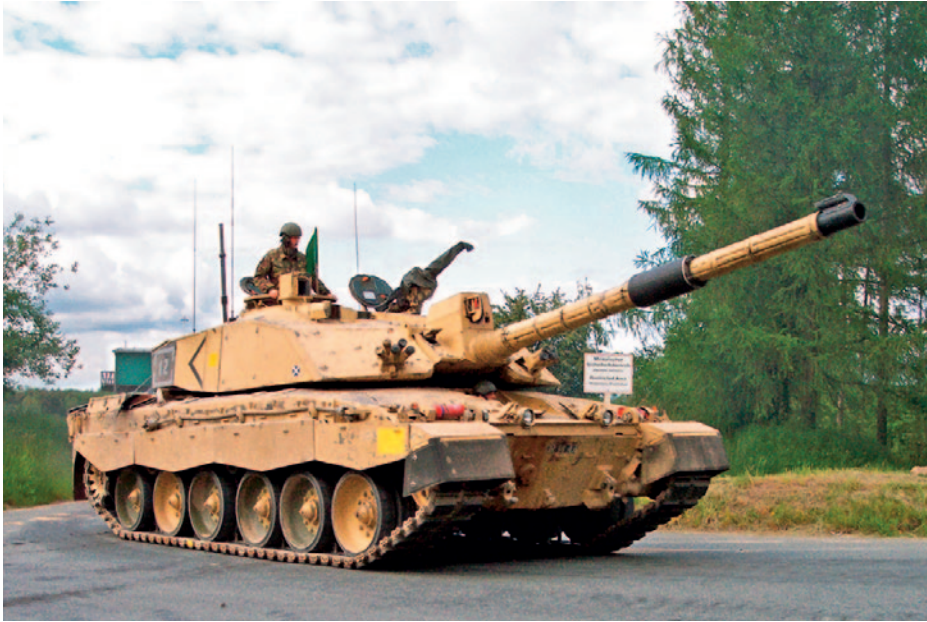
Carro de combate Challenger II .

tecnológica como motor del cambio o la determinación de concertar todos los instrumentos del potencial nacional para afrontar estos retos que decidirán la configuración del poder mundial futuro. Una integración que también es necesaria para anticiparse, enfrentarse y recuperarse de riesgos como el terrorismo o el crimen organizado y, muy especialmente, de las actividades bajo el umbral del conflicto realizadas por las potencias revisionistas.