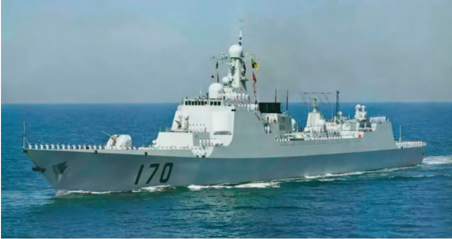
El Lanzhou (DDG-170) destructor Tipo 052C.

guerra electrónica, ciberespacio... dejando a China como una de las potencias mejor posicionadas para explotar un escenario multidominio.