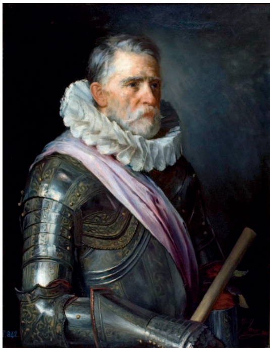
Francisco Jover y Casanova. Retrato de Luis de Requesens y Zúñiga. (Museo Nacional del Prado)

Como vemos, Felipe II quería que Requesens no fuera solo el segundo de su hermano para suplirle en su ausencia o enfermedad, que eran las atribuciones propias del cargo, sino que le otorgaba facultades de consejero y tutor. Pero llegados a este punto, el lector neófito se preguntará quién era Requesens y cómo era posible que Felipe II confiara tanto en él.