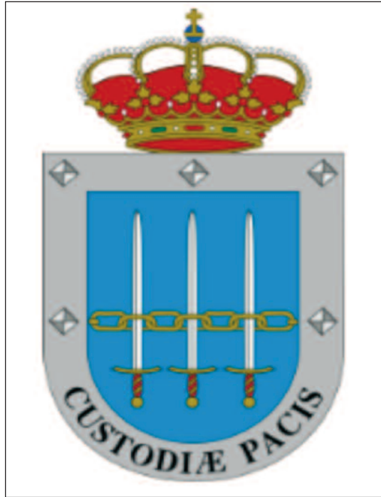
Escudo del Mando de Operaciones.

Ubicado en su origen en las instalaciones del EMAD en la madrileña calle Vitruvio, en el mes de marzo del 2016 el MOPS se trasladó a sus nuevas insta-