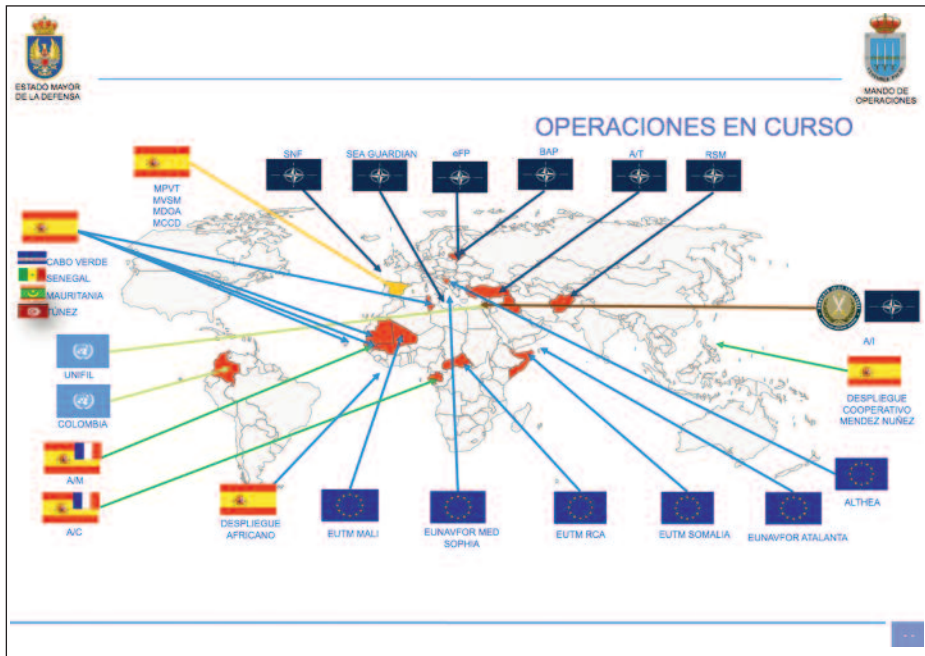
Operaciones en curso, 1 de noviembre de 2019. (Elaboración de los autores).