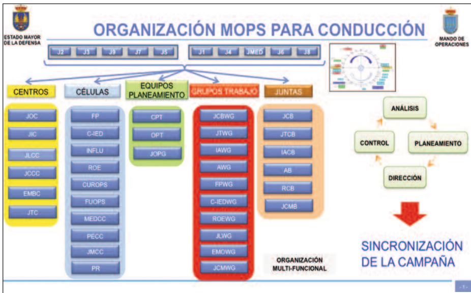
Conducción en el Mando de Operaciones. (Elaboración de los autores).

Sin embargo, para el planeamiento y conducción de las operaciones, el Estado Mayor se organiza en centros, equipos de planeamiento, juntas y grupos de trabajo, permitiendo así el análisis de cualquier situación desde un