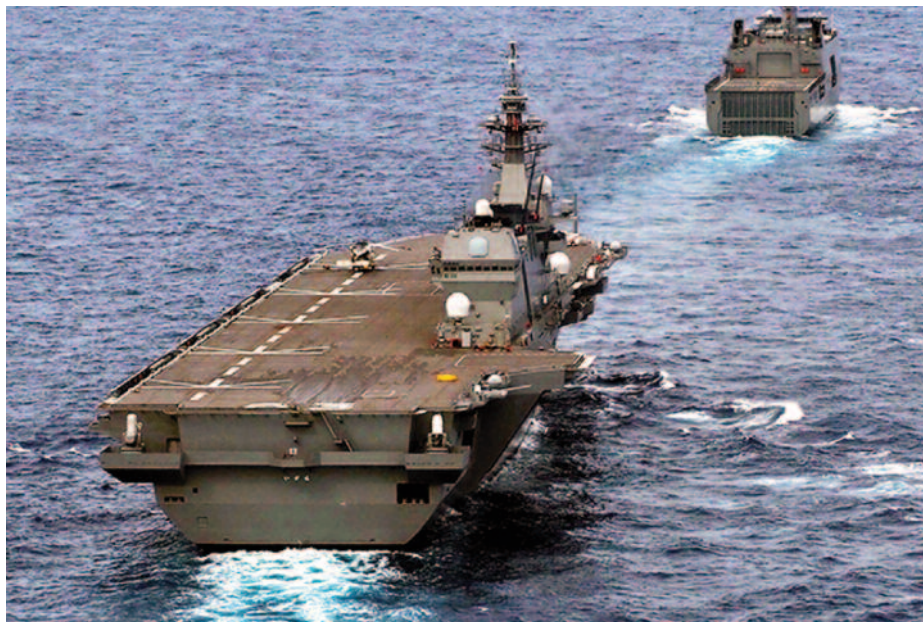
Figura 6. Portaeronaes Izumo .

discusión sobre la utilidad de su empleo (34), fundamentalmente considerando las posibles operaciones en Asia marítima. Es más que razonable pensar que los Estados Unidos no arriesgarán su fuerza de portaviones desplegándolos en la denominada killing zone para proyectar los grupos aéreos embarcados sobre el territorio continental, al menos bajo las condiciones de amenaza actuales y mientras carezcan de armas de defensa netamente superiores. Sin embargo, su velocidad y su permanencia en aguas abiertas con unidades de apoyo siguen permitiendo a la US Navy mantener un control indiscutible de los océanos. Esto posiblemente también se podría llevar a cabo con buques de menor porte y más baratos, portaviones de desplazamiento más reducido y propulsión convencional armados con aviones F-35B , misión que ya podrían desempeñar los LHA America (35) o los clase Izumo japoneses, y que ejemplificarían el ya mencionado concepto de Sea Control Ship nuevamente de actualidad. Un debate que