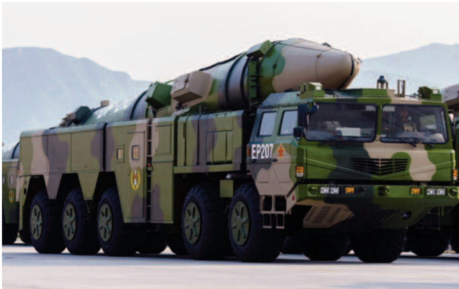
Figura 5. Misil DF-21D..

En lo que se refiere a la guerra antisubmarina, que indudablemente estaría en el centro de la guerra en la mar, es difícil conocer la preparación y eficacia reales de la MEPL, aunque en los últimos años ha hecho avances muy significativos en cuanto a medios, dotándose de fragatas con sonares remolcados, nuevos aviones de patrulla marítima y helicópteros ASW (33), capacidades que resultarían vitales en una pugna por obtener el control del mar en aguas interiores a las cadenas de islas. Medios que también serían esenciales para los Estados Unidos y sus aliados en las aguas próximas a las islas y para defender los grupos de ataque en el Índico y el Pacífico. El uso de portaaviones antisubmarinos de las clases japonesas Izumo y Hyūga podrían tener esa misión (fig. 5), y el empleo de sensores acústicos activos y pasivos de largo alcance y de la aviación de patrulla marítima se antojan también imprescindibles para ambos bandos.