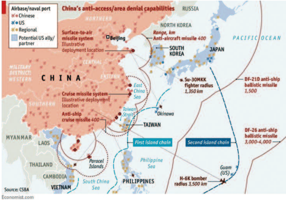
Figura 4. Crumple zone de Holmes, arcos de las armas máximos desde la línea de costa. (Fuente: CSBA, tomado de Economist.com ).

directos con la US Navy hasta que consiguiese debilitar a esta lo suficiente. Por el contrario, las misiones de la US Navy serían mantener el control del mar en aguas abiertas del Pacífico y del Índico, asegurar la llegada de refuerzos a la primera cadena de islas y, finalmente, conseguir proyectar su fuerza sobre el territorio de Asia continental, todo lo cual requiere unas enormes capacidades navales y de resiliencia (23).