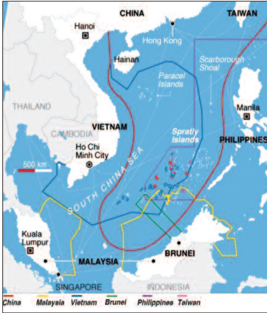
Figura 2. Reclamaciones superpuestas en el mar Meridional de China.

potencias han emergido» (6), la realidad es que su expansión naval tiene un importantísimo impacto en la geopolítica de Asia; y precisamente en el centro del escenario asiático se encuentran los mares Este y Meridional de China que, con el de Japón, conforman el Mediterráneo asiático. Mares contenidos por estados insulares —con varios de los cuales China tiene importantes contenciosos abiertos (7) (fig. 2)—, por los que accede a las aguas abiertas del Pacífico y del Índico. Tal como señala Kagan, «poder es la capacidad de conseguir que otros hagan lo que tú quieres y evitar que hagan lo que no quieres» (8). Así, China está forzando a sus vecinos marí-