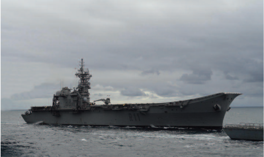
Portaviones Príncipe de Asturias (R-11).

de Midway o del golfo de Leyte, algo que ya estaría influyendo en los futuros diseños de esos buques y que en el Extremo Oriente está dando lugar a nuevas clases de portaaviones que reflejan el concepto de Sea Control Ship de nuestro desaparecido Príncipe de Asturias .