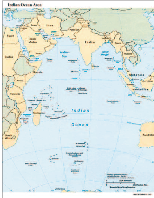
Figura. 3. Región del océano Índico.

mundo en capacidades y la primera en número de buques (10). Sin embargo, la totalidad de su litoral se encuentra rodeado de naciones marítimas que ven con enorme preocupación su expansión naval y se están dotando de marinas formidables. Japón o Corea del Sur disponen de un número de fragatas y destructores con excelentes capacidades de combate, muy superiores a las de cualquier marina europea. Además, ambos países en los últimos años han puesto en servicio buques anfibios multipropósito y portaaviones que cada vez más parecen responder a misiones de control del mar (11). Más allá de Malaca, en la denominada región del océano Índico (fig. 3), la India trata de establecer su preponderancia naval. Sin embargo, y además de encontrar importantes dificultades para el desarrollo de su programa naval (12), China ya se ha hecho presente para «permanecer, actuar y ser tenida en cuenta» (13) a través de intereses comerciales —la famosa «cadena