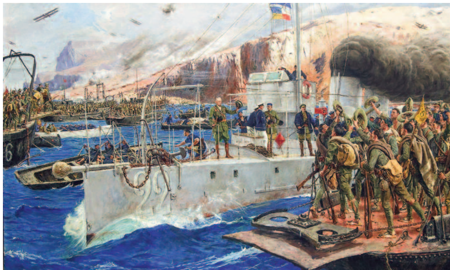
Pintura de José Moreno Carbonero. Sobre la cubierta del Torpedero 22 aparecen los generales Miguel Primo de Rivera (1870-1930) y José Sanjurjo Sacanell (1872-1936); al fondo se puede ver el Morro Nuevo.

Esas primeras imágenes podrían inducirnos a pensar que este tipo de operaciones son vestigios del pasado, pero estaríamos cayendo en el error de confundir la parte con el todo, ya que no solo existen los asaltos anfibios a gran escala en el mundo de las operaciones anfibias, ni estas fuerzas únicamente sirven para ser empleadas en situaciones de conflicto convencional (4). Su utilidad es diversa y se pueden emplear en muchos otros cometidos (5).