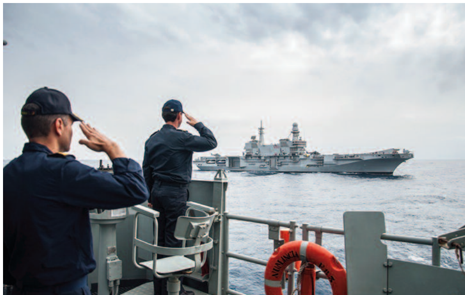
La fragata Numancia participando en el Ejercicio ERMO 2016.

grupos europeos formados por UKNLAF y SIAF-SILF respectivamente, por lo que la interoperabilidad se ha mantenido en estos dos ámbitos principalmente. Y también en estas agrupaciones es habitual que se integren unidades de otros países con los que se opera de forma habitual, como pueden ser destacamentos portugueses (los denominados Fuzileiros) con nuestros infantes de Marina en ejercicios nacionales e internacionales anfibios.