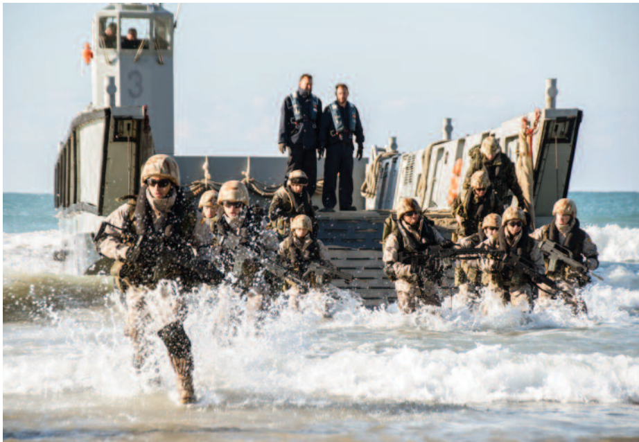
Ejercicio anfibio MARFIBEX-72 desarrollado en el golfo de Cádiz y la sierra del Retín..

LPD ( Galicia y Castilla ), ni sobre el relevo de las LCM o sobre los futuros medios de la Fuerza de Desembarco (36).