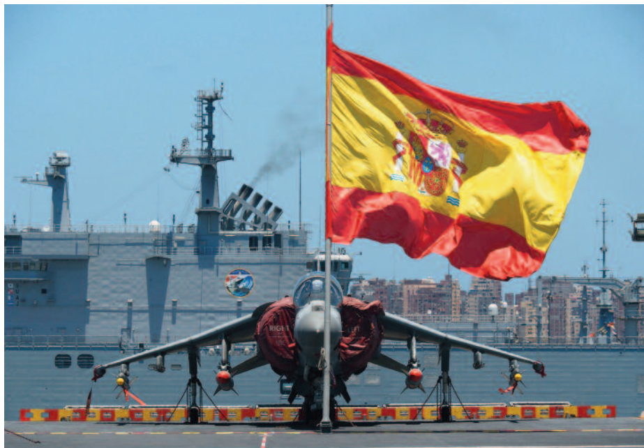
El buque Juan Carlos I y la fragata Blas de Lezo en Alejandría.

uno de los mayores riesgos para conseguir los objetivos planteados por la organización, que sin duda agravará los problemas de partida ya identificados.