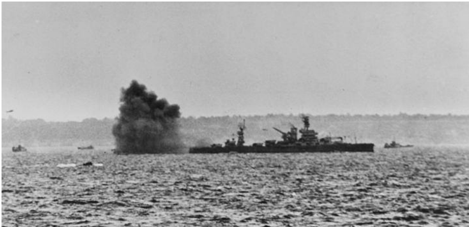
El USS Arkansas (BB-33) disparando su montaje de 12 pulgadas hacia posiciones alemanas en apoyo a los desembarcos en la playa de Omaha el 6 de junio 1944. (Foto: wikicommons ).

Al nombrar las operaciones anfibias, a muchos de nosotros nos vendrán a la mente escenas del día «D» durante la Segunda Guerra Mundial en las costas de Normandía (1944), mientras a otros, más interesados en la Historia Militar de España, puede que los lleve a pensar en Alhucemas (1925), en donde se llevó a cabo el primer desembarco anfibio «conjunto y combinado» con éxito de la era moderna (3).