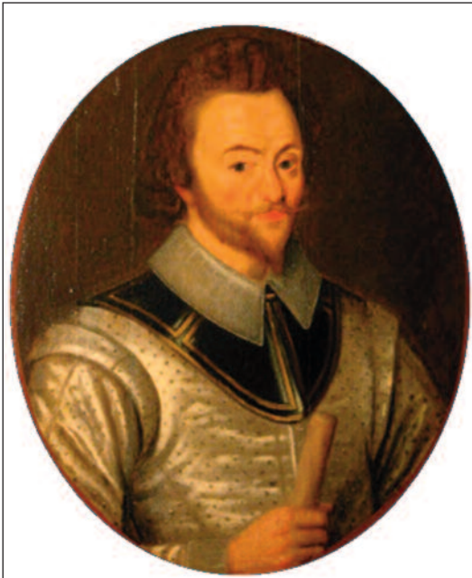
John Norris.

El 25, los buques ingleses fondearon a la altura de Peniche, 70 km al norte de Lisboa. Una vez allí se celebró un consejo para deliberar la mejor línea de acción para la toma de la capital lusa. Drake y Norris tuvieron una acalorada discusión, ya que sus posturas eran irreconciliables. Drake quería desembarcar en las proximidades de la ciudad y tomarla cuanto antes —este era el plan que más temía Alonso de Bazán, el general de las galeras de Lisboa, y el más lógico—, mientras que Norris pretendía desembarcar en Pe-