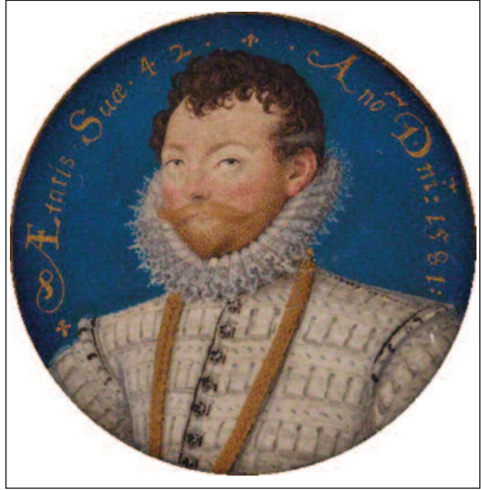
Francis Drake, 1581.

Los anglicanos se dedicaron no solo a saquear, sino a quemar y profanar iglesias, hospitales y otros edificios de la ciudad. El hospital de La Magdalena, en la plaza Mayor, fue pasto de las llamas después de que los incendiarios hubiesen destrozado a golpes las dos imágenes que había en la capilla y de