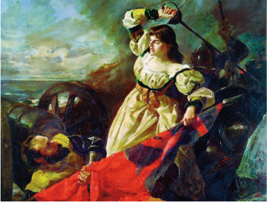
María Pita, óleo de Arturo Fernández Cersa. Ayuntamiento de La Coruña.

decía a los invasores, rebajó aún más la moral de los españoles. Pero esta situación duró solo unos segundos. Casi al mismo tiempo, una mujer española cogió un sable de un soldado muerto y arremetió a sablazos contra el abandonado con tal furia que en una fracción de segundos el hombre cayó a tierra arrastrando la bandera con él. Una vez en el suelo, la dama lo ensartó, acabando con su vida. La visión del inglés y la bandera derribados al lado de una fémina enfurecida, sable en mano y con el rostro y los brazos salpicados con la sangre del enemigo, paralizó a los atacantes mientras que, simultáneamente, arrancó un rugido de admiración de las gargantas de los españoles. La protagonista de la acción era Mayor Fernández de la Cámara Pita, más conocida como María Pita, y estaba furiosa porque acababa de perder en combate a su «segundo» marido (la buena señora se casó cuatro veces y enviudó otras tantas). Gracias a este acontecimiento, el aumento de la moral combativa de los defensores hizo posible aguantar la lucha hasta el final, en un combate que duró unas dos horas y que finalizó con una retirada de los ingleses, que dejaron muchas armas abandonadas, además de la bandera del alférez muerto por la heroína española.