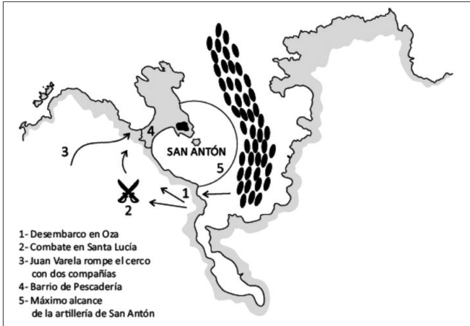
Desembarco de Drake en La Coruña.

Entre los días 6 y 11 de mayo, mientras los defensores se dedicaron a reforzar con piedras las murallas de la ciudad para hacerlas más resistentes a un cañoneo, los atacantes preparaban el sitio, incluyendo la excavación de un túnel para poner una mina bajo la torre que se encontraba enfrente del monasterio de Santo Domingo, donde se habían atrincherado los hombres de Norris. El 11, las tropas invasoras lanzaron su primer ataque con escalas por la Puerta Real, pero fueron rechazados. Ese mismo día, se terminó de construir el baluarte para instalar la artillería de sitio, comenzando el bombardeo de la muralla de la ciudad, que sufrió una brecha por su parte superior. Al día siguiente, la mina subterránea fue detonada, pero los cálculos de distancia fueron erróneos e hizo explosión fuera de las murallas, por lo que los asaltantes continuaron con la excavación del túnel.