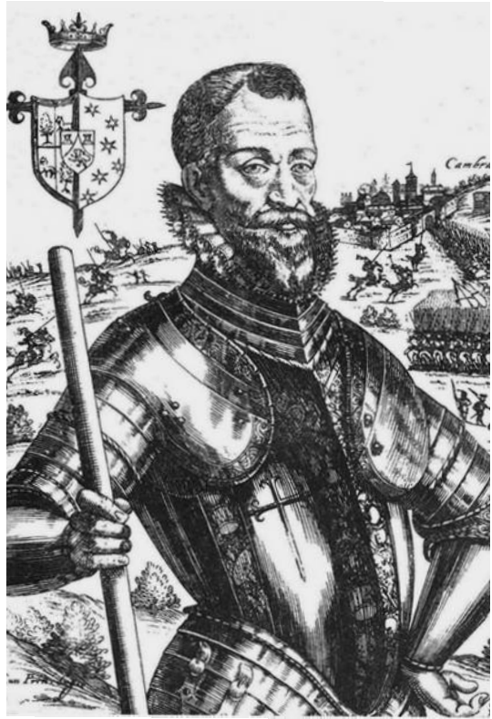
Pedro Enríquez de Acevedo, conde de Fuentes. (Bosquejo encomiástico.).

El día 15 llegó a Lisboa el adelantado de Castilla, Martín de Padilla, con 15 galeras, lo que hizo más comprometida la situación de los ingleses en Cascais, ya que Padilla había preparado seis brulotes en el castillo de San Felipe (Setúbal), esperando vientos favorables para lanzarlos sobre la Armada inglesa fondeada. Esta amenaza, sumada al hambre de los hombres de Drake y