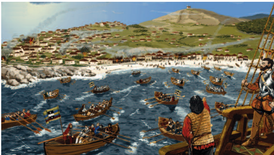
Ataque de Francis Drake y Henry Norreys a Vigo en 1589.

haber matado y quemado a una pobre anciana enferma que no había podido ser evacuada. Una vez dispersados, los invasores fueron atacados en diversos puntos por los habitantes locales, que habían puesto sus familias a salvo, y por la pequeña fuerza de soldados españoles. Después de quemar la iglesia de San Salvador de Teis y de haberse llevado el coro a sus buques, intentaron hacer lo mismo con San Fausto de Chapela, pero fueron rechazados por los vigueses. Hubo otra lucha violenta en la que los herejes perdieron muchos hombres que querían profanar la iglesia de Santa Cristina de Lavadores.