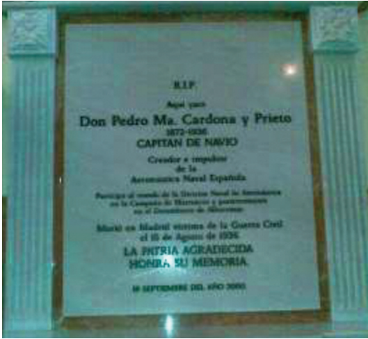
Lápida en el Panteón de Marineros Ilustres.

consecuencias posteriores. Probablemente tampoco ayudó a evitar su suerte el hecho de que ocupara la presidencia de la Liga Marítima, organización en el punto de mira de los radicales.