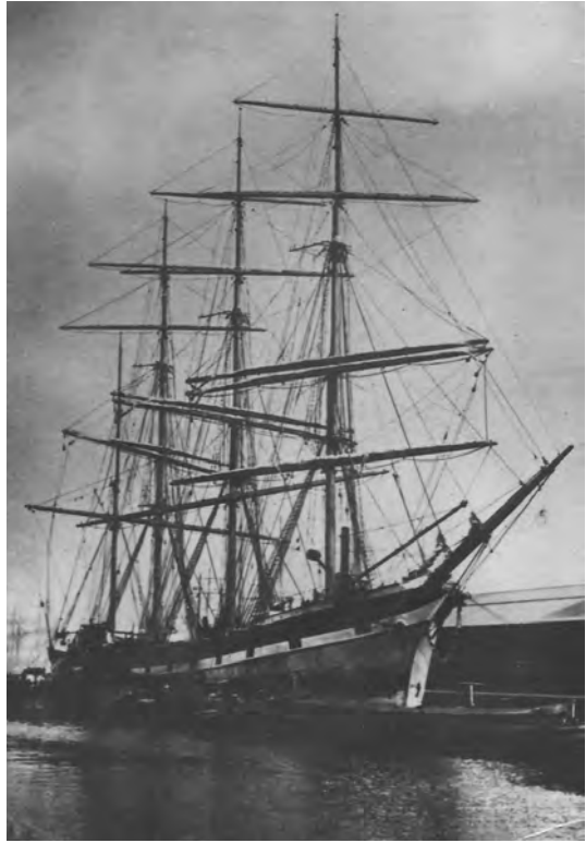
Fotografía que muestra al Jordan Hill , después Augustella , futuro Minerva , atracado en Hull.