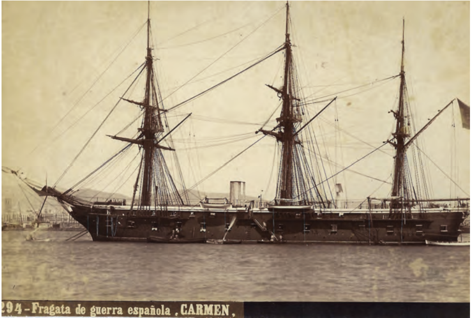
Fragata Carmen , buque escuela de guardiamarinas.

servicio activo tras rendir su último viaje de instrucción en mayo y fue armada en el Arsenal de Ferrol como escuela de marinería, donde permaneció hasta 1899, que fue baja definitiva en la Armada.