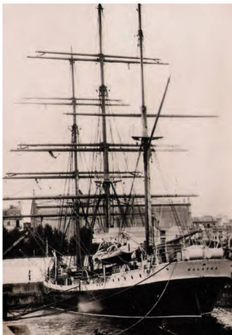
El Galatea en el dique de la Campana en 1936.

na de primer y segundo cursos que efectuarían un crucero de un mes. El 28 se llega a Cádiz, trasladándose a La Carraca al día siguiente.