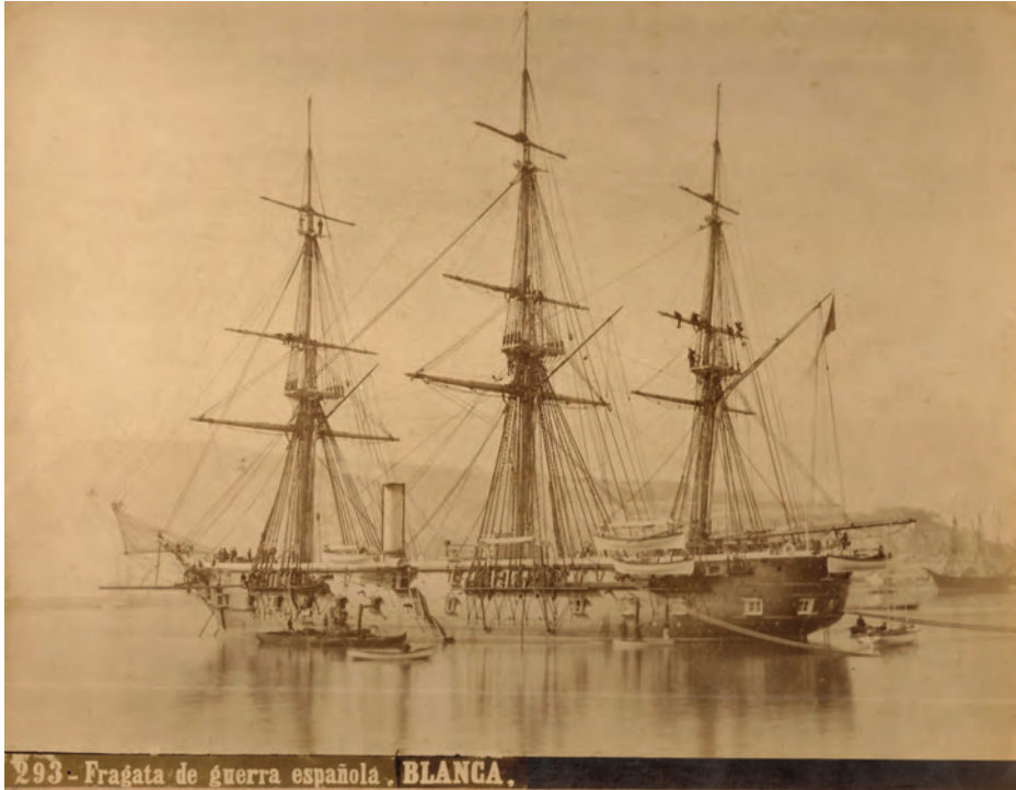
La fragata Blanca fondeada en Barcelona en sus tiempos de buque escuela de guardiamarinas.

tocando después Cherburgo, Brest y entrando finalmente en Ferrol el 28 de agosto. Al menos dos libros, aunque desde perspectivas muy diferentes, tratan de este viaje. Federico Montaldo escribió el primero en 1887, titulado Desde la toldilla. Impresiones y bocetos , desde un punto de vista naval, y la obra de Odón de Buen, De Kristiana a Tuggurt, impresiones de un viaje , aporta una visión científica.