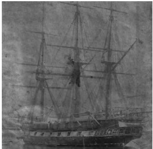
Fragata Almansa , buque escuela de guardiamarinas en sus tiempos de escuela de marinería, fondeada en el Arsenal de Ferrol.

En 1885, el entonces teniente de navío de primera Fernando Villaamil, destinado en el Ministerio de Marina, efectuó un estudio para organizar la instrucción del personal, proponiendo, entre otras cosas, la adquisición de tres veleros para utilizarlos en la