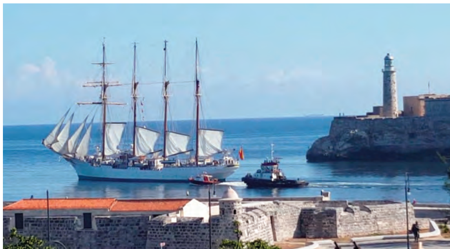
La misma toma en mayo de 2016 a la salida de La Habana.