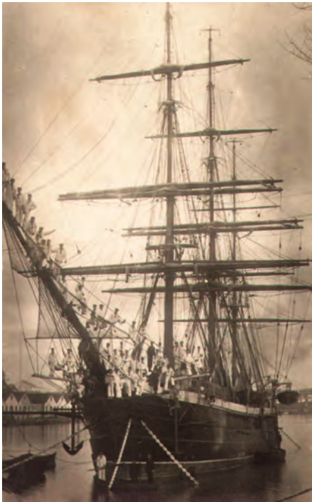
Postal fotográfica tomada en el Arsenal de Ferrol, donde se ve a la dotación de la Nautilus en el bauprés del buque.

instrucción de oficiales, clases y marinería (1). En cumplimiento de la disposición anterior, en el año de 1886, siendo ministro el vicealmirante Pezuela y recogiendo el testigo de su antecesor en el cargo, el almirante Juan Bautista Antequera, ordena a Villaamil adquirir en Inglaterra, donde se encontraba comisionado para la construcción del destructor, un buque mercante de proporciones para escuela de guardiamarinas. En 15 días se cumplió la comisión comprando el clíper Carrick Castle , que se encontraba atracado en Londres. Su coste fue de 60.000 pesetas, pero al servir de transporte de armas submarinas entre Inglaterra y España, cuyo flete ascendía a 120.000, la compra del buque resultó gratis y amortizada desde un principio. Dos oficiales de la Armada, junto con 20 miembros de dotación, trasladaron el buque de Londres a Cádiz.