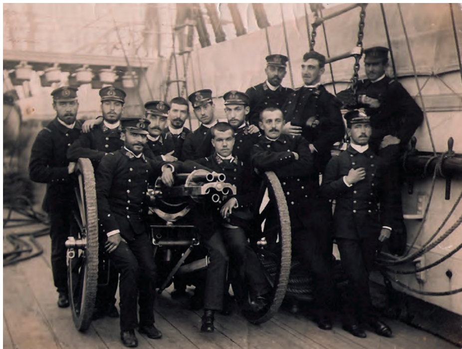
Guardiamarinas a bordo de la Gerona en Cartagena en 1889.

Tras este primer año en el buque escuela, los guardiamarinas tenían que pasar tres más en este empleo; el primero de ellos en navíos de primera clase, el segundo en buques de primera o segunda y el tercero en unidades de primera, segunda o tercera clase. Los últimos cuatro meses antes de examinarse para alféreces de navío los tenían que pasar preparando los temas a bordo de un buque, que durante gran parte del tiempo que estuvo la Naval en Ferrol fue la fragata Almansa . Este esquema, con variación de tiempo y unidades, fue el que imperó buena parte del período del trabajo.