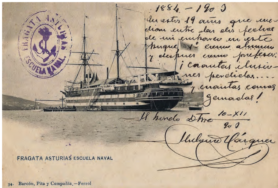
Postal que muestra la Asturias fondeada en frente de La Graña en su fondeadero de invierno, enviada por un profesor de la Escuela Naval Flotante.