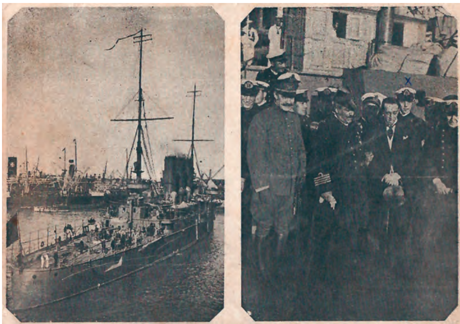
Postal argentina donde se muestra al crucero y a sus mandos en 1919 actuando como buque escuela.

Una vez finalizada la contienda, haría uno por el Mediterráneo y otro por el Atlántico. En 1920 realizó otro entre el 10 de mayo y el 31 de julio, tocando Barcelona, Toulón, Génova, La Spezia, Livorno, Nápoles, Malta, Alejandría, Bizerta, Argel, Orán, Chafarinas —donde efectuaron ejercicios de artillería—, Melilla, Ceuta y Tánger, regresando a La Carraca. En octubre cruzó el Atlántico, entrando en Buenos Aires.