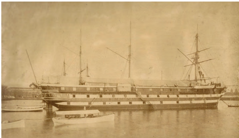
La fragata Asturias tomada en el fondeadero de invierno en el muelle núm. 5 del Arsenal de Ferrol, sede de la Escuela Naval Flotante durante más de tres décadas.