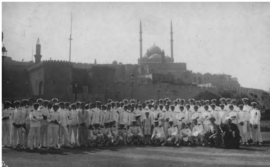
Los aspirantes en El Cairo en el viaje de instrucción de 1920 del Reina Regente .

En 1921 efectuó un nuevo crucero, que empezó el 3 de septiembre y terminó el 27 de noviembre, comenzando en Vigo, Marín —donde se efectuaron ejercicios de artillería—, Vigo de nuevo, Cádiz, Tánger, Algeciras, Melilla, Cartagena, Palma de Mallorca, Mahón, Ibiza, Barcelona, Valencia, Almería, Santa Cruz de la Palma, San Sebastián de la Gomera, Santa Cruz de Tenerife, Las Palmas, rindiendo viaje en Ferrol. Aún participó entre 1922 y 1924 en las campañas marroquíes.