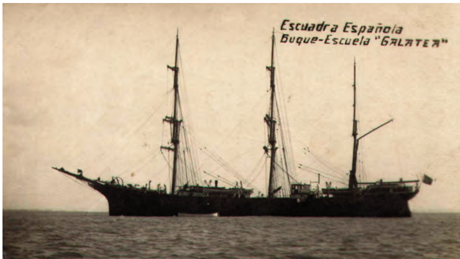
El Galatea con su antigua configuración, sin el puente elevado.