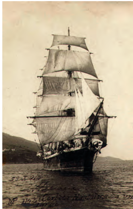
La corbeta Nautilus a todo trapo en 1913 en las rías gallegas.