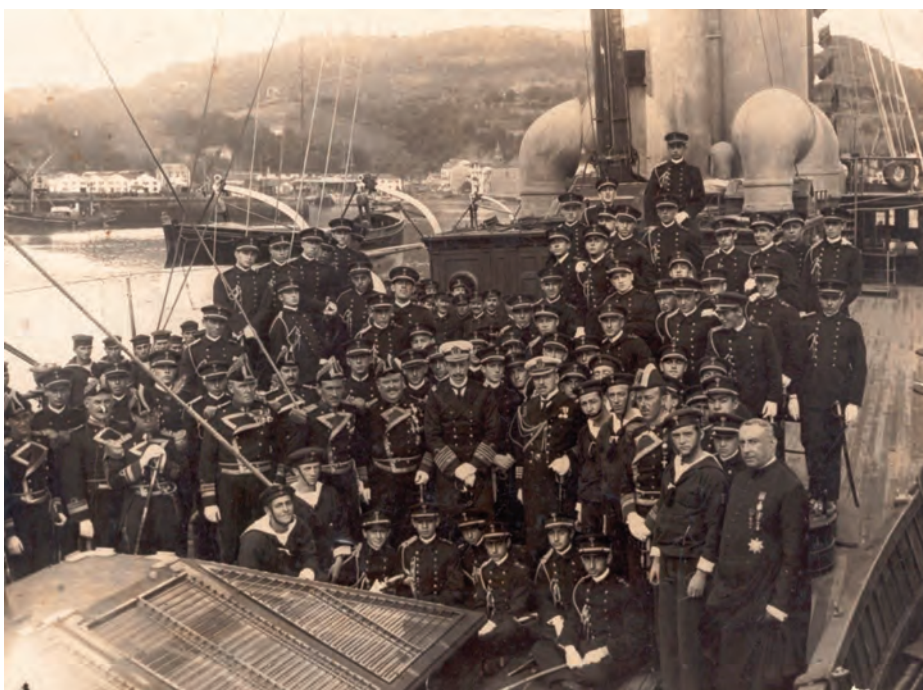
Fotografía tomada en el crucero de instrucción de 1919 del Giralda , donde se ve a las promociones de aspirantes de primero y segundo con S. M. el Rey.

Ante la carencia de buques escuela de aprendices marineros —ya que se había dado de baja la Nautilus — y de guardiamarinas, el 26 de diciembre de 1921 el almirante Federico Ibáñez y Varela recibió el mandato de adquirir en el extranjero, con cargo a la Ley Miranda y lo más rápidamente posible, los buques necesarios para cubrir las carencias que la Armada tenía planteadas. El resultado fue inmediato y el día 8 de marzo de 1922 los buques Clarastella y Augustella fueron adquiridos en Italia y recibieron los nombres de Galatea y Minerva .