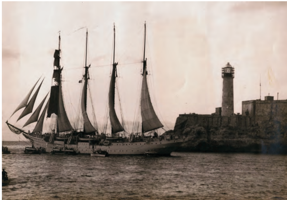
El buque escuela Juan Sebastián de Elcano saliendo de La Habana en 1929.