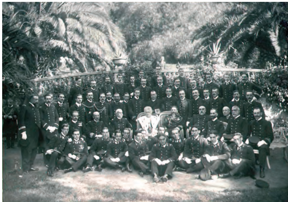
Fotografía de S. A. R. la Infanta Isabel junto a las dotaciones de la Nautilus y el Carlos V en Buenos Aires en 1910.

El segundo suceso es que a finales de este año dejó de ser buque escuela de guardiamarinas para convertirse en escuela de aprendices marineros. El 29 de agosto de ese año entró por última vez en Ferrol con esa condición, comenzando las obras para transformarla en la nueva escuela. Como ya adelanté, en posteriores entregas pretendo profundizar en la vida de este emblemático buque escuela ligada a la formación de oficiales de la Armada.