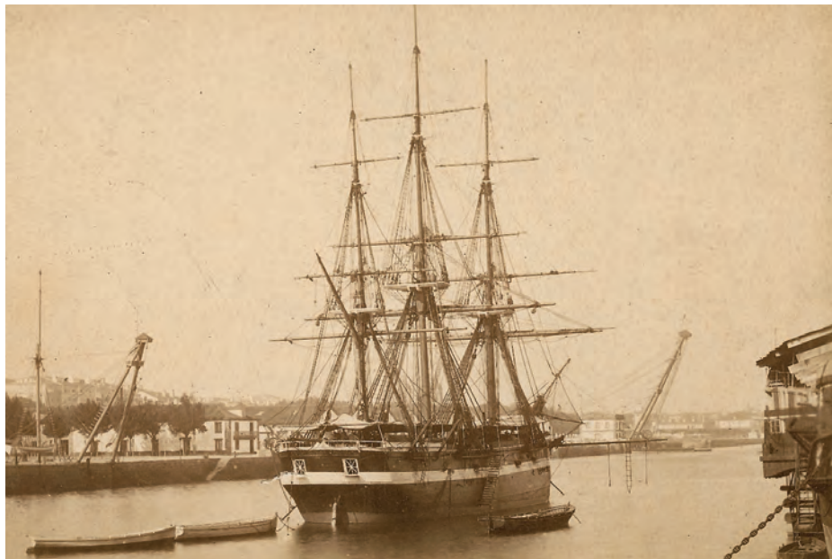
La corbeta Villa de Bilbao fondeada en la dársena del Arsenal de Ferrol; actuó como buque escuela de guardiamarinas, de marinería y, posteriormente, de aprendices marineros. (Colección: Guillermo Escrigas).

verdadero buque escuela de vela, para finalizar con unas pinceladas sobre el Galatea como escuela de aspirantes de Marina.