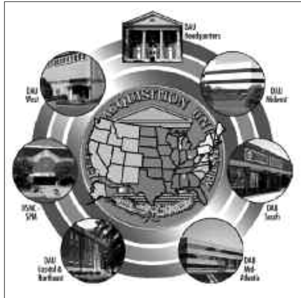
Fig. 2: la DAU como universidad corporativa. (Fuente: DAU).