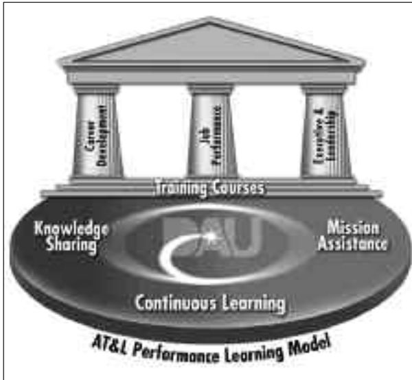
Fig. 3: Modelo de Aprendizaje Basado en el Desempeño.

ción es obligatoria. Es decir, la formación está claramente asociada al perfil de carrera.