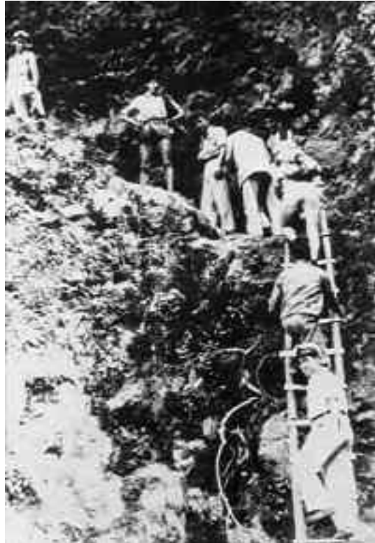
Complicada ruta por la isla de La Palma en 1959.

Para atender a los aspectos logísticos se contrataron dos caballerías con las que transportar víveres y material. Con ellas, se realizaban viajes entre Santo Domingo y unos puntos acordados, donde se distribuía el personal y se efectuaba su reabastecimiento. A veces, los destacamentos se veían obligados a improvisar habilidades poco acordes con la actividad naval, como fue el apeo de 14 grandes pinos para conseguir visibilidad desde uno de los vértices, faena que precisó de la autorización previa del ingeniero jefe de Montes y se llevó a cabo bajo la atenta presencia de un guar-