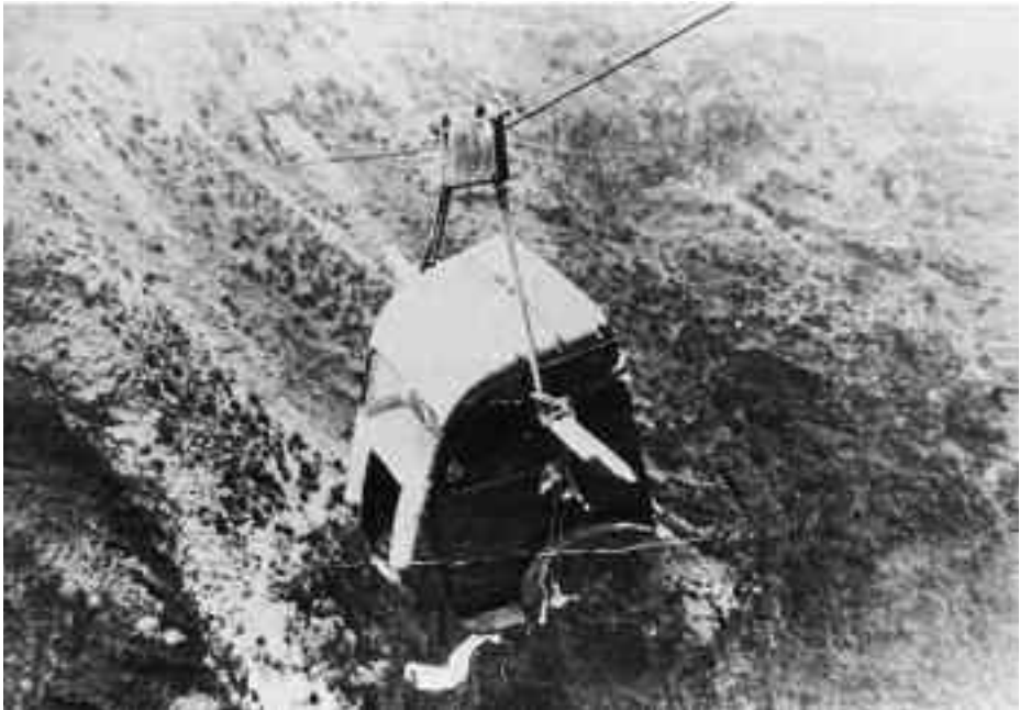
La cabina del camión sobre el vacío del barranco.

Y así se hizo. El valioso camión, siniestramente desmembrado, fue traído desde Santa Cruz y depositado al borde del barranco. Alguna de esas partes, concretamente el bastidor, superaba ligeramente el peso máximo recomendado, pero ya no cabía otra cosa que cerrar los ojos y confiar en que aquello aguantara. Después de tres largos días, en los que el cable y los brazos humanos trabajaron a destajo, los distintos componentes del vehículo alcanzaron la otra orilla y fueron vueltos a ensamblar menos de un kilómetro más allá. La maniobra resultó laboriosa, pero el provecho fue grande. A pesar de que el