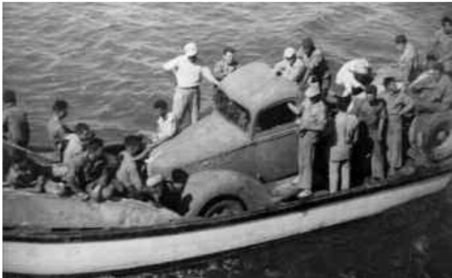
Una imagen habitual en la hidrografía de los años 50.

lamentable estado del terreno obligaba a moverse a muy poca velocidad, con marchas cortas y empleando la doble tracción, no hubo un solo percance serio durante los muchos viajes que se hicieron por aquella accidentada pista. A ello contribuyó, sin duda, la experiencia y la pericia de su mecánico conductor, fiel exponente de un grupo de operarios de la Maestranza que, asignado a las comisiones, y a pesar de su impermeabilidad a las cuestiones técnicas, llegó a convertirse en verdadera leyenda de la hidrografía, alguno de ellos con más campañas a sus espaldas que la mayoría de los especialistas.