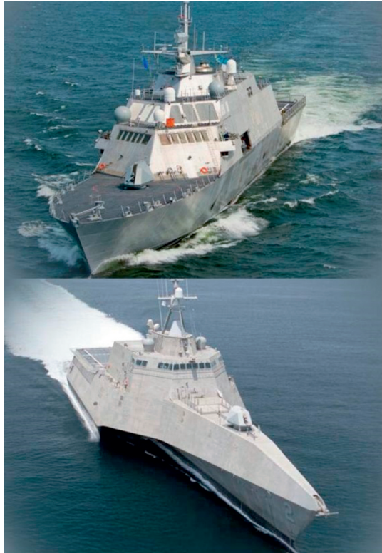
Infografía 2. Los dos LCS.

El programa ha sufrido graves retrasos, incluyendo diversos problemas de corrosiones en el casco y fallos en la propulsión en los dos tipos de SEA FRAME existentes, así como múltiples crecimientos del presupuesto, obligando a rediseñar los tres paquetes de misión . El paquete MCM, probablemente el más urgente de todos, se ha retrasado debido a problemas de fiabilidad que al parecer han sido ya solucionados. Este paquete fue profundamente cambiado después de la cancelación del Sistema Aerotransportado Rápido de Eliminación de Minas (RAMICS) y de los sistemas AQS-20A MCM a