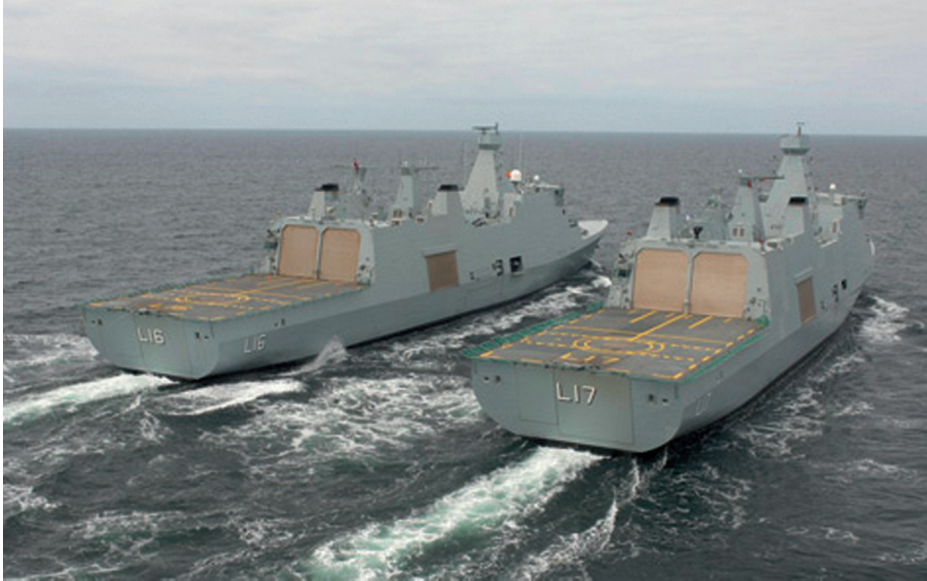
Infografía 1. Fragata clase Absalom .

intercambiar una familia de módulos insertos en contenedores que permite cambiar en pocas horas de función (ASUW, ASW, MCM, soporte a buceadores, hidrográficos o antipolución). En 2004 este concepto se revisó y las unidades fueron «congeladas» para una capacidad específica, limitando su capacidad de intercambio de equipamiento hasta que, después de 15 o 20 años de servicio se fueron dando de baja.