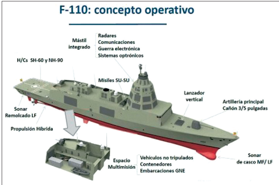
Infografía 4. F-110.

La Armada española está evaluando posibles soluciones para la clase F-110 (infografía 4), que reemplazará a las fragatas de la clase Santa María . Este proyecto ha sido definido oficialmente como «de usos múltiples y versátil», capaz de disponer de unas capacidades a medio camino entre las del BAM (buque de acción marítima) y las de las fragatas clase F-100 . El casco incluirá una gran zona de usos múltiples en su popa, alojando la RHIB de 11 m, VDS, módulos contenedores y vehículos no tripulados (USV y UUV).