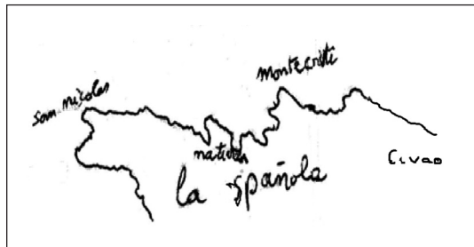
Boceto de La Española en 1493 realizado por Cristóbal Colón.

Alonso de Chaves, hacia 1535, nos da las señas del Puerto de Navidad y de Monte Cristo: «Este puerto es pequeño para navíos pequeños (19). Monte Cristo está en 20 ½