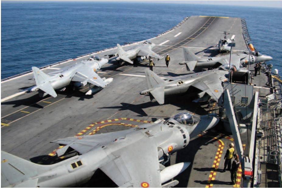
Operaciones aéreas en el PDA Príncipe de Asturias . (Foto: C. Cárdenas Crespo).

aeronaves no tripuladas y las tripuladas, comparación en la que estas últimas salen mal paradas.