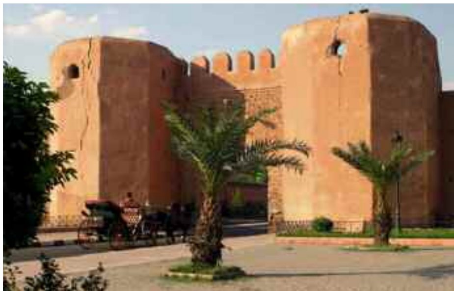
Murallas de Marrakech.

En la audiencia de despedida, el embajador llevó de regalo (no debía acudir con las manos vacías a cualquier entrevista con el sultán) otras seis