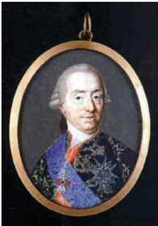
Marqués de Grimaldi.

No debiendo ser larga la misión de V. E. en aquel país, poco agradable, no será interrumpida la presencia de V. E. donde la necesita el Bailío. (Es decir: el secretario de marina D. Julián Arriaga, que debió oponerse a la ausencia de Juan).