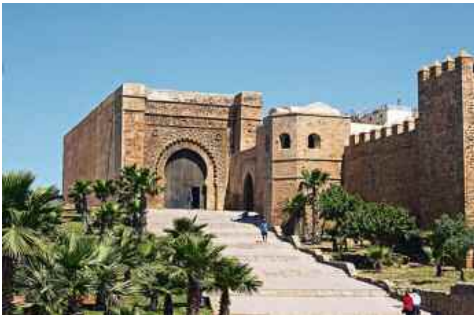
Castillo de los Udayas de Rabat.

al primer incidente diplomático; pues un secretario del Sultán tuvo la desfachatez de insistir en «que le diera la palabra de hacerle un regalo».