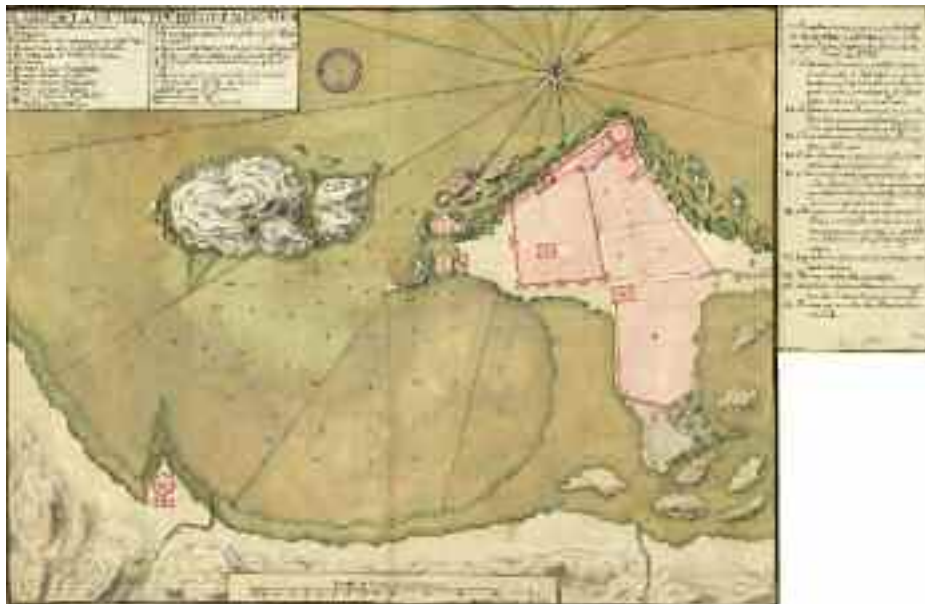
Archivo Histórico Nacional. Plano de Mogador, de 1775. Seguramente levantado por los oficiales que acompañaron a Jorge Juan.

secretario Sanz) publicar unas «Noticias generales del reino de Marruecos» (no tienen el alcance, son apenas once folios manuscritos, ni, por supuesto, la trascendencia de las «Noticias Secretas de América» que escribió con Ulloa). Destacan las siguientes cuestiones: