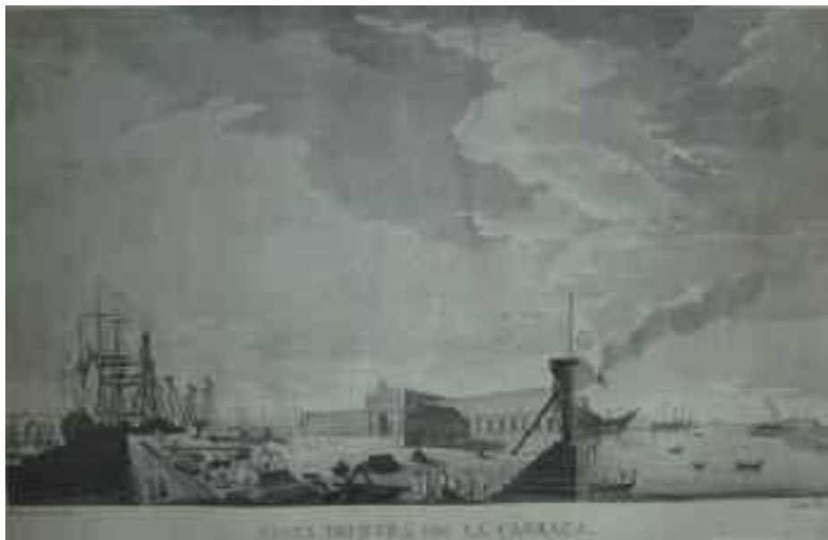
Arsenal de La Carraca. (Museo Naval de Madrid).