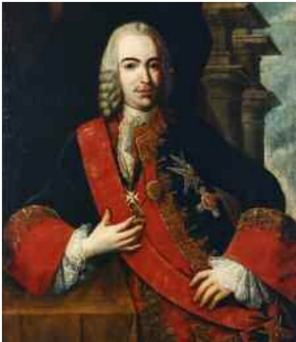
Marqués de la Ensenada. (Museo Naval de Madrid).

Muestra de la satisfacción que Ensenada tenía con la labor del sabio y marino son estas palabras dirigidas a su Rey: