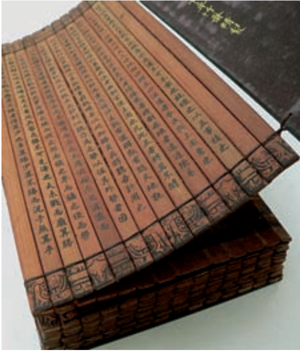
El arte de la guerra en bambú.

que entenderla, conocer sus motivaciones, descubrir cuáles son sus temores, aprender su estructura social y saber cómo se relacionan. Solo de esta forma se conseguirá atraer a la población según nuestros intereses y evitar que colaboren con la insurgencia.