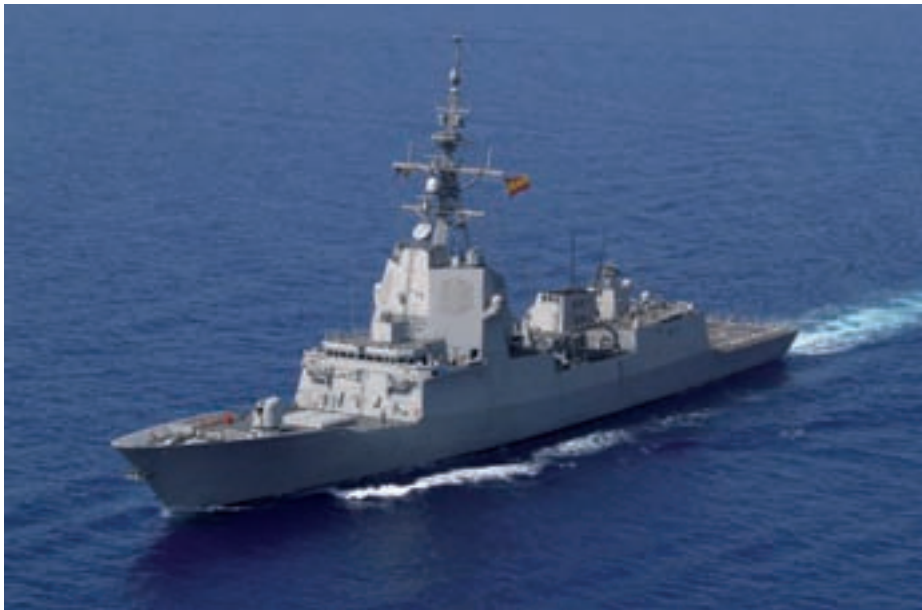
Fragata F-100 Blas de Lezo .