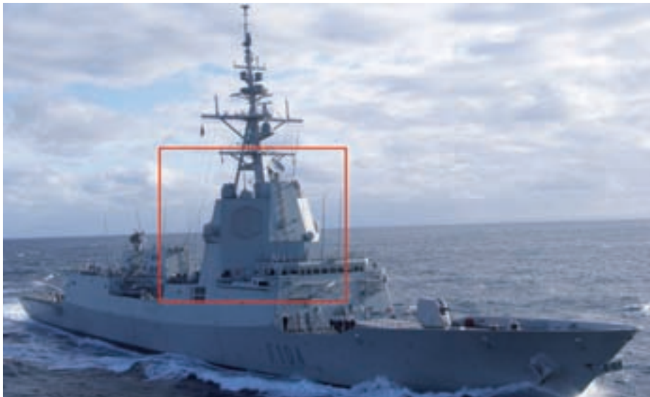
Escudo Aegis de la fragata F-100 .