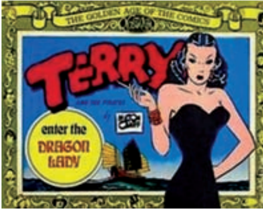
Terry y los piratas. Dragon Lady .

recibido de su difunto abuelo el mapa de un tesoro situado en una mina de algún lugar de China, país al que acude junto a su protector, Pat Ryan, un experto aventurero, a los que se une George Webster Confucius (Connie), un chino que les sirve de intérprete. La acción se desarrolla fundamentalmente en la costa china de los años 30, con predilección por las bandas de piratas o bandidos con líderes como Skull, Eyetooth o la fundamental Dama Dragón, que lidera una banda de piratas que asola los mares de China.