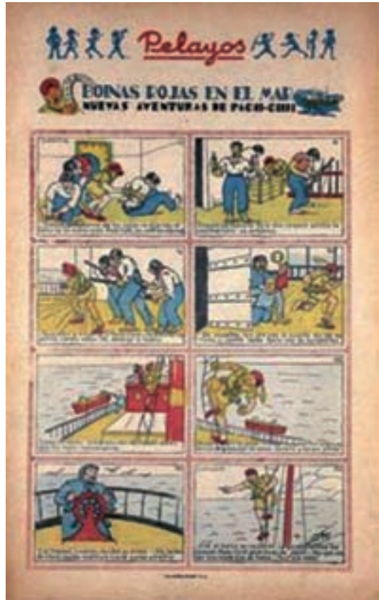
Pelayos. Aventuras de Pachi-Chiki.