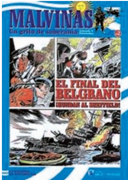
Malvinas. Un grito de soberanía.

que hacían una referencia más o menos satírica a la guerra, con el paso de los años han aparecido obras que han acometido de una manera más realista los acontecimientos: La batalla de las Malvinas (Ediciones Fierro, 1984) o Malvinas. Un grito de soberanía (2011), publicada por Ediciones Argenti-