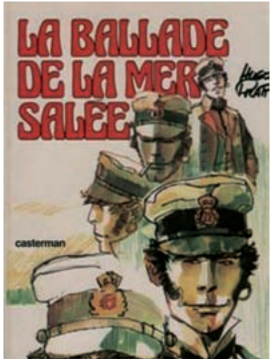
Corto Maltés. La balada del Mar Salado .

Nos encontramos con un aventurero nacido en una isla en mitad del Mediterráneo (Malta), cuyos padres son una gitana de Gibraltar y un lobo de mar británico. Destaca, por encima de todo, su personalidad, mezcla de seductor, espíritu libre ansioso de aventuras pero con un particular código de honor que le lleva a asociarse con piratas sin escrúpulos, como Rasputín o El Monje, a los que intenta mantener a raya. «Yo soy el océano Pacífico y soy el más grande» (15): así comienza la primera viñeta de La balada del mar Salado , obra que reúne todos los tópicos y características que Pratt quiso imbuir en Corto. Su sed de aventuras le llevó a viajar por todo el mundo (Argentina, Siberia, Venecia, Turquía, Francia, Somalia, Hong-Kong,