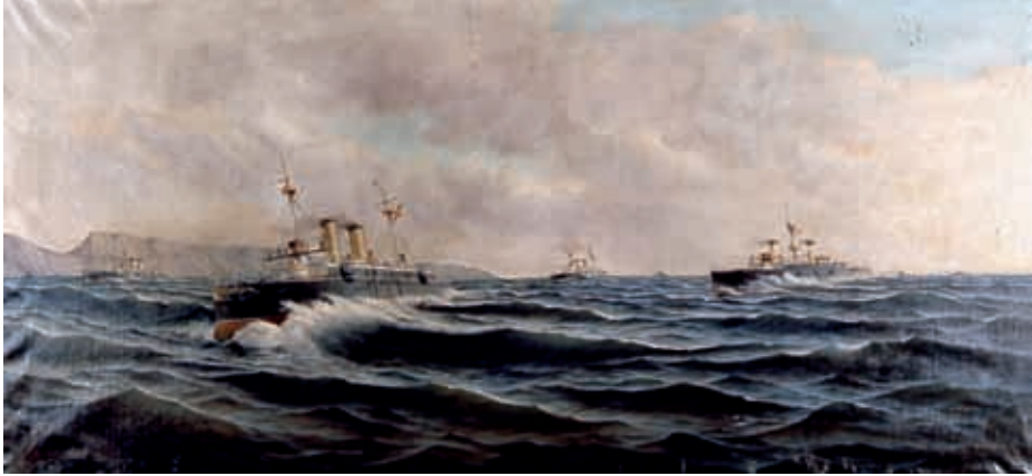
Combate del puerto de Cárdenas (Cuba), 1898.

los restos de este heroico batallón desfilaron ante toda la División del Ejército del Norte que, presentándole armas, le hizo un mudo homenaje de admiración y respeto.