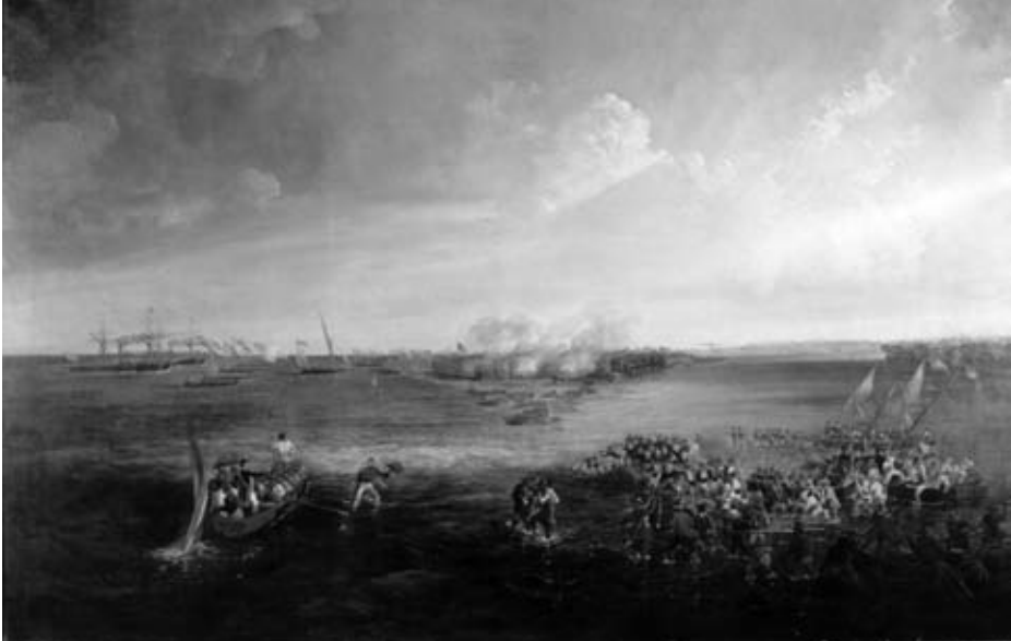
Toma de los fuertes de Balanguingui (Filipinas), 1848.

1860, señaladamente en el bombardeo de Arcila y Tetuán); del Pacífico y bombardeo de El Callao (1865, allí ganó la laureada el marinero Fernando Miranda Caamaño); de la tercera Guerra Carlista (1872-1876); de las Carolinas (1887), y de Cuba y Filipinas.