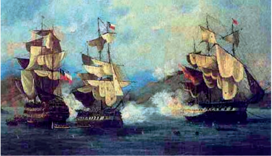
Combate de la Esmeralda .

Colombia) por fuerzas insurgentes, en 1815, sostuvo valerosamente el combate durante cuatro horas, hasta que, muerta más de un tercio de la tripulación y herida el resto, él mismo incluido, hubo de rendirse. Conducido a los calabozos de Cartagena de Indias, sufrió la misma suerte que los demás prisioneros españoles, que perecieron en una masacre general. Pudo sobrevivir milagrosamente a pesar de estar casi degollado y con dieciocho heridas, y volver a España, donde alcanzó el empleo de teniente de navío; pero hubo de llevar durante el resto de sus días —prolongados hasta 1854— un artilugio de hierro que le permitía llevar la cabeza derecha sobre los hombros.