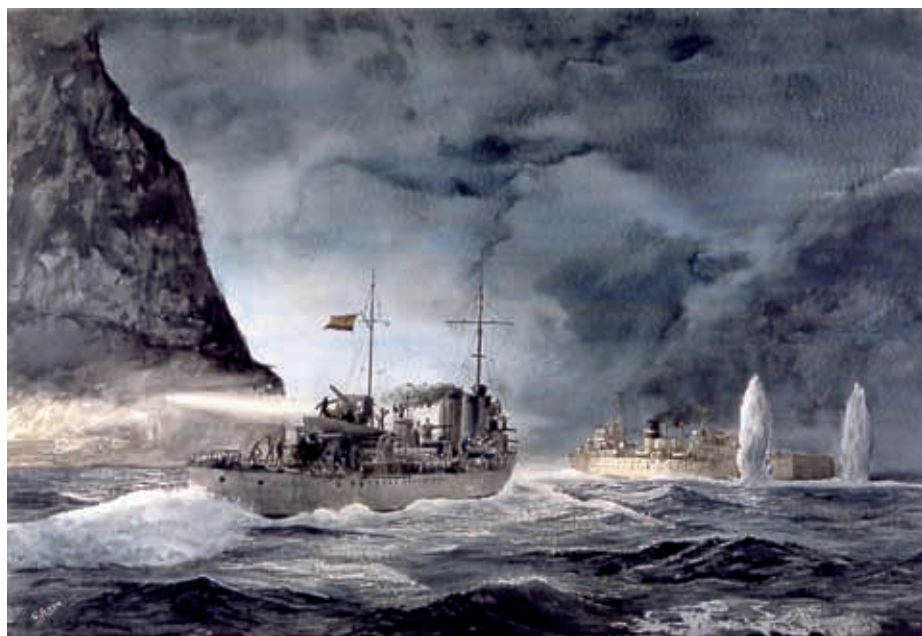
Combate del Vulcano y el José Luis Díez , 1936.