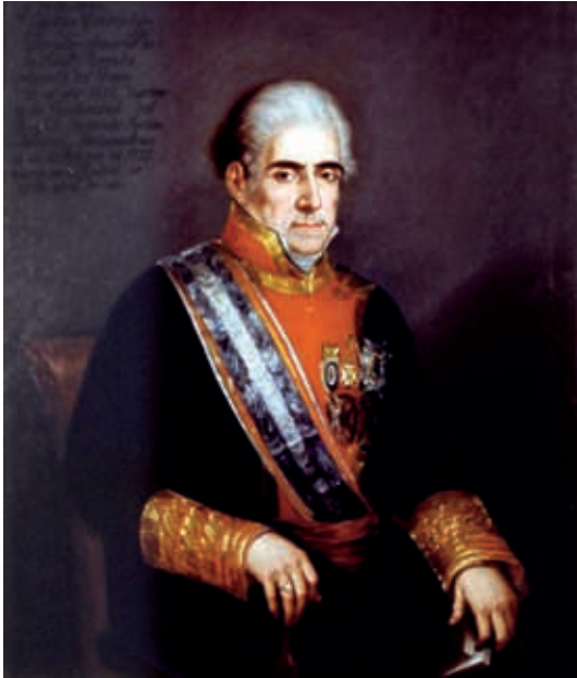
Retrato del capitán general Villavicencio, defensor de Cádiz en 1810-1812.