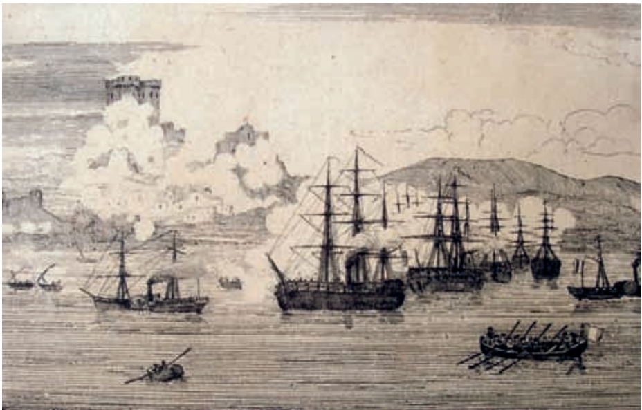
Bombardeo de Tetuán (Marruecos), 1860.