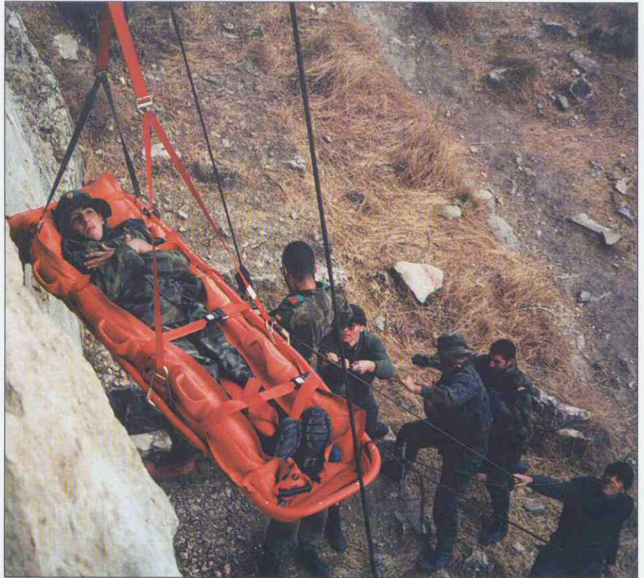
Fig. 1 y 2.- Prácticas de rescate y evacuación en montaña con camilla tipo "nido".

"Apoyo Sanitario a las Fuerzas de Resistencia: Los objetivos del Servicio de Apoyo Sanitario, son conservar la Fuerza Combatiente