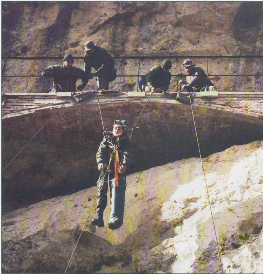
Fig. 3 y 4.- Prácticas de evacuación en montaña de un herido previamente inmovilizado.