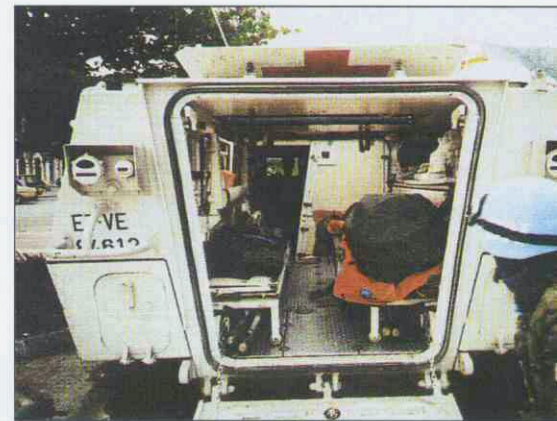
Fig. 5.- Vista posterior de un BMR-Ambulancia con colchón de vacío, férulas hinchables, desfibrilador, respirador manual...

Todo esto da una idea de la trascendencia de la Sanidad dentro de las U.O.E.s, siendo así como se considera en los ejércitos modernos pertenecientes a la OTAN; por lo que resulta de suma importancia, para situarnos al nivel de la organización a la que pertenecemos.