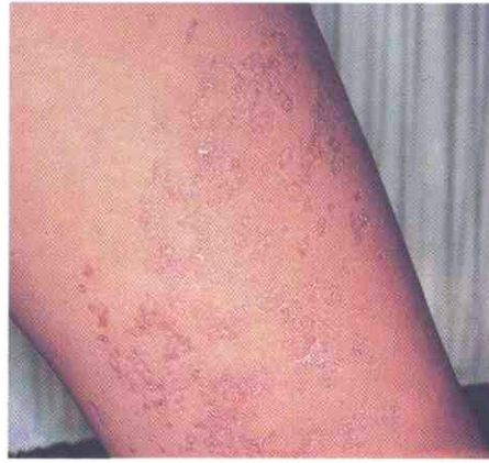
Fig. 1. Lesiones en cara interna de muslo izquierdo. Obsérvese como los surcos de atrofia dibujan unos contornos circinados de borde ligeramente elevado (en el que se inserta la laminilla cornoide) y un fondo más oscuro por transparencia sanguínea a causa de la atrofia epidérmica.