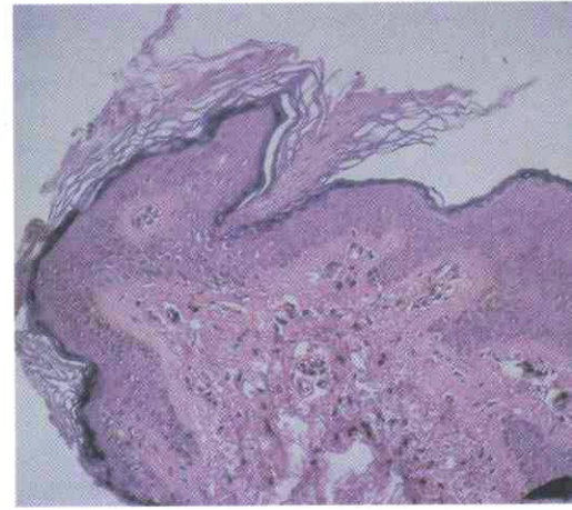
Fig. 7. En la periferia de la lesión no se aprecia atrofia de la epidermis, si no el espigón o laminilla corneida. A nivel dérmico se observan telangiectasias. H.E. \times 250 .

in patients with porokeratosis of Mibelli". J. Natl. Cancer Inst. 51: 371. 1973.