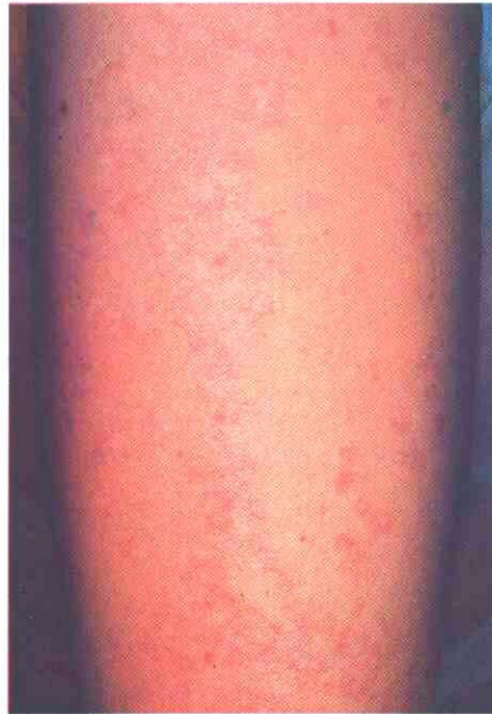
Fig. 4. Con mayor detalle, se observa que a pesar de la distribución lineal de las lesiones, existen claras áreas de atrofia epidérmica, circunscritas que nunca se encuentra en el nevus epidérmico lineal.