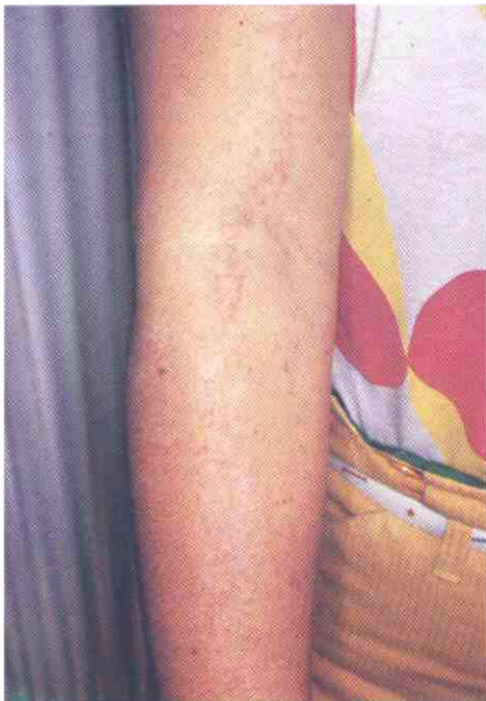
Fig. 3. Las lesiones en extremidades superiores adoptan una distribución lineal, que recuerda clínicamente al nevus epidérmico lineal.

Como ya se dijo, aunque hasta el momento la terapéutica sea escasamente eficaz, es vital el control periódico de estos pacientes con vistas al diagnóstico precoz de una posible degeneración en epiteloma espinocelular.