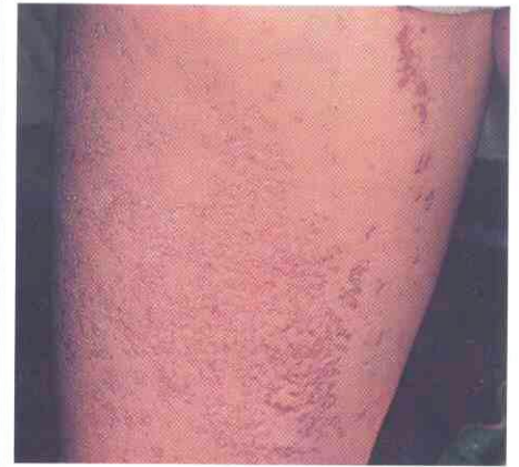
Fig. 2. Lesiones en cara interna de muslo derecho. La confluencia de las lesiones circinadas confiere a la piel un aspecto abigarrado y retiforme. Las lesiones más antiguas, en la parte superior derecha muestran marcada hiperpigmentación.