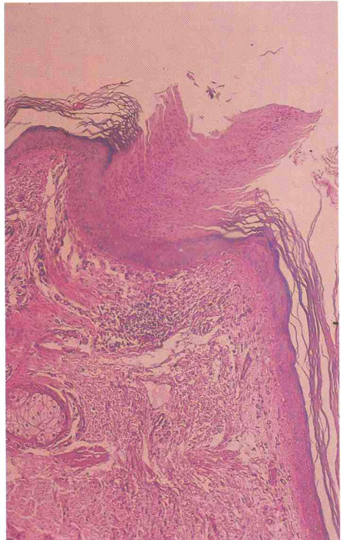
Fig 8. Caso de Poroqueratosis actínica superficial diseminada (P.A.S.D.) en el que se aprecia la laminilla corneida centrada en el infundíbulo de un folículo pilosebáceo. H.E. \times 400 .