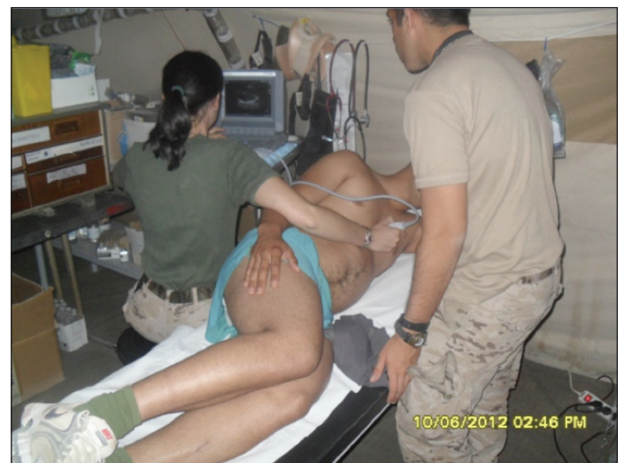
Figura 3. Capitán Médico realizando ecocardiograma en la enfermería del Puesto Avanzado de Combate «Ricketts» de Muqur (Afganistán).

Tal distanciamiento kilométrico, sumado a la complicación existente para iniciar cualquier movimiento sobre el terreno (sea terrestre y/o aéreo) por el peligro existente en una zona de conflicto bélico activo, da una idea de las limitaciones existentes para evacuar cualquier baja. Por lo que a la hora de tomar decisiones, éstas, deben ser equilibradas con las premisas de riesgo y beneficio; además de valorar las repercusiones tácticas que una evacuación puede suponer al conjunto de la Operación. Sin que ello suponga demora alguna en la evacuación de cualquier baja que lo precise, ya que en Zona de Operaciones el Mando debe asegurar todos los medios y posibilidades de evacuación necesarias, sí se deben equilibrar muy concienzudamente todas las decisiones al respecto con el fin de conseguir que una baja «demorable» no precipite acontecimientos que supongan un riesgo o repercusión táctica en la Operación; y del mismo modo, que una baja «no demorable» no suponga la pérdida de una vida, si es que necesita ser evacuada de inmediato. Es ahí donde radica la «vital» importancia de mensurar adecuadamente la necesidad o no de una evacuación inmediata.