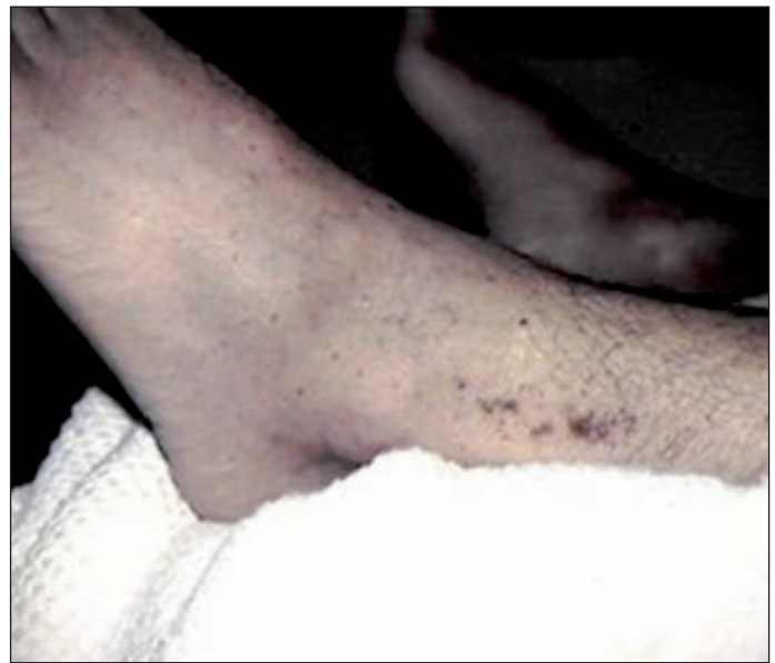
Figura 2. Clínica hemorrágica del dengue, Petequias.

La causa del dengue complicado hay que buscarla en el hecho, ya citado, de que la infección da lugar al desarrollo de anticuerpos circulantes que normalmente protegen contra el serotipo implicado, pero que a veces hacen que se agrave una segunda infección,