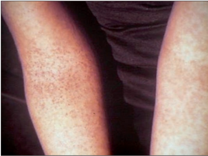
Figura 4. Prueba del torniquete positiva.

mortalidad elevada (sin tratamiento hasta un 50%), presentándose a cualquier edad, pero más frecuentemente en niños. Si no se corrige inmediatamente este cuadro, puede evolucionar rápidamente a un shock profundo y a la muerte del paciente.