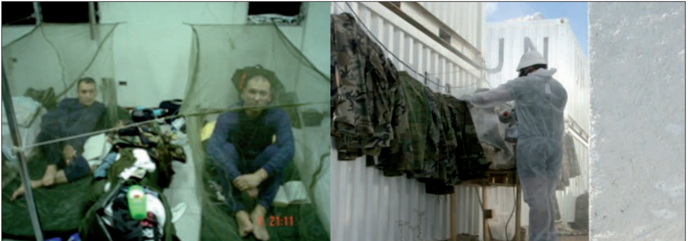
Figura 6. Mosquiteras e impregnación de uniformes.

lugares de la Base o del Buque generalmente concurridos, recordando la existencia del mosquito y cómo protegerse, así como charlas informativas periódicas recordando las principales enfermedades infecciosas de la zona (Fig. 7). Otra herramienta muy indicada para la difusión de conceptos importantes en prevención es utilizar el periódico de la Base (cuya existencia es frecuente en todas nuestras operaciones) para insertar pequeñas cuñas sobre los mosquitos y la enfermedad.