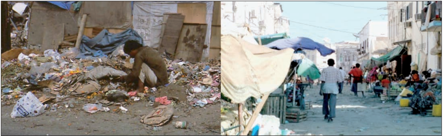
Figura 5: Basuras en Fort Liberté y calles de Djibouti con basura sin recoger.

(con bases en las ciudades de Fort Liberté y de Ouanaminthe) en el transcurso de una Operación Mantenimiento de la Paz respaldada por la ONU (MINUSTAH).