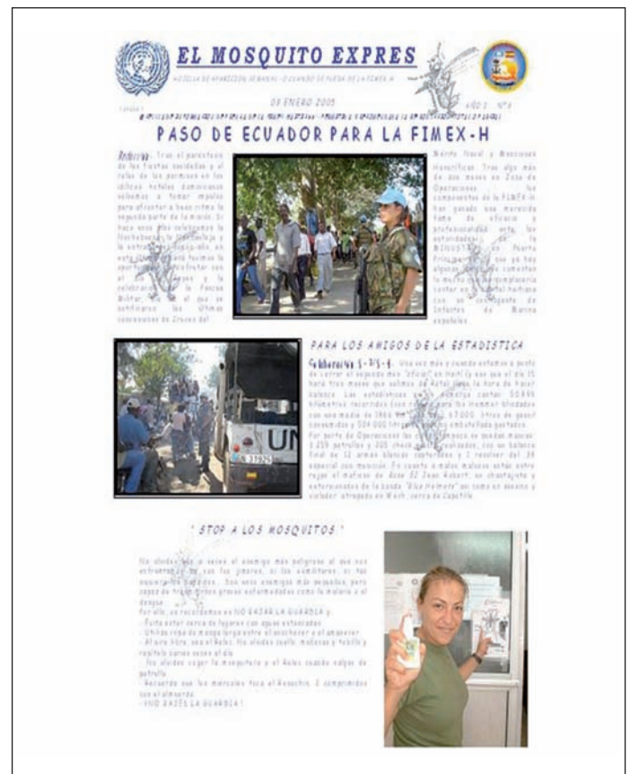
Figura 7. Mosquito Express (Periódico de la Base en Fort Liberté, Haití, 2006).