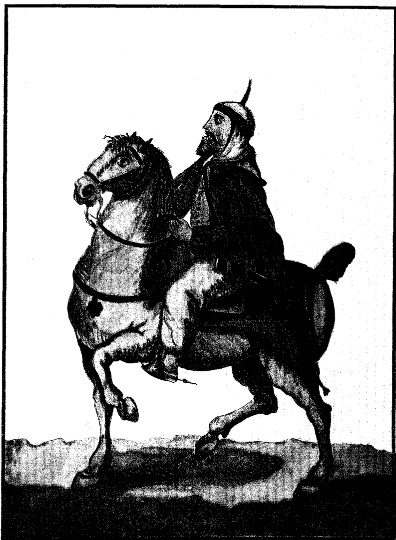
Jinete de la Compañía de Moros Almogatazes de Orán . Fue creada en 1734. Dibujo del álbum manuscrito Estado Militar de España... sobre el último Reglamento de este año de 1790 .