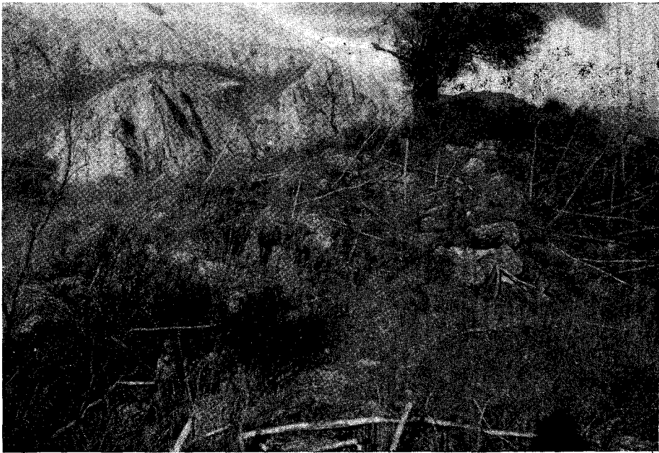
Esto es todo lo que queda hoy del castillo o palacio-fortaleza de Bobastro, materialmente arrasado por Abderrahmán III: un montón de piedras que apenas permite seguir la línea de los cimientos.